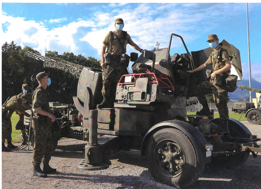
«Und der Himmel brennt»: Fliegerabwehrsoldaten posieren stolz mit ihrem Waffensystem.

Französisch kommuniziert. Aufgrund der Verkleinerung der Armee gibt es nicht mehr für alle Sprachregionen eine eigene Abteilung.