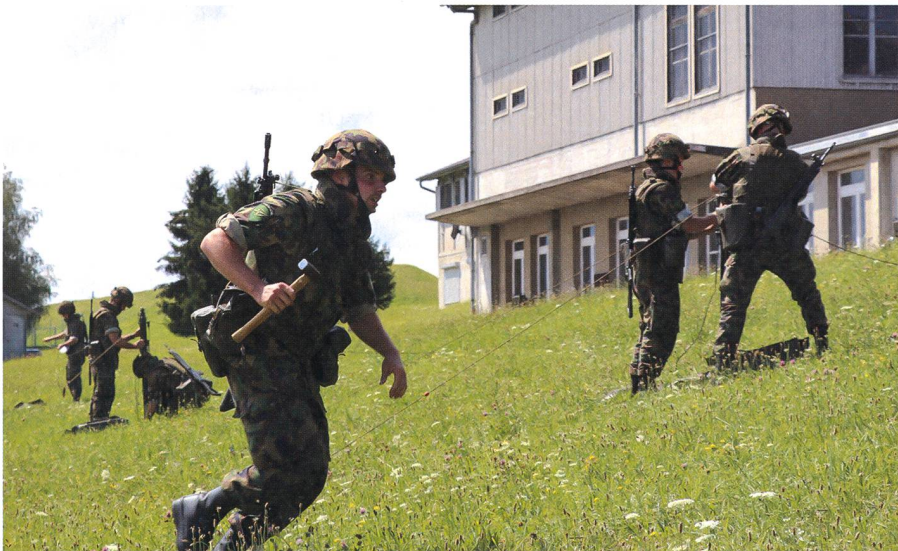
Voller Einsatz: Die Übermittlungssoldaten trainieren den Aufbau einer Antenne.