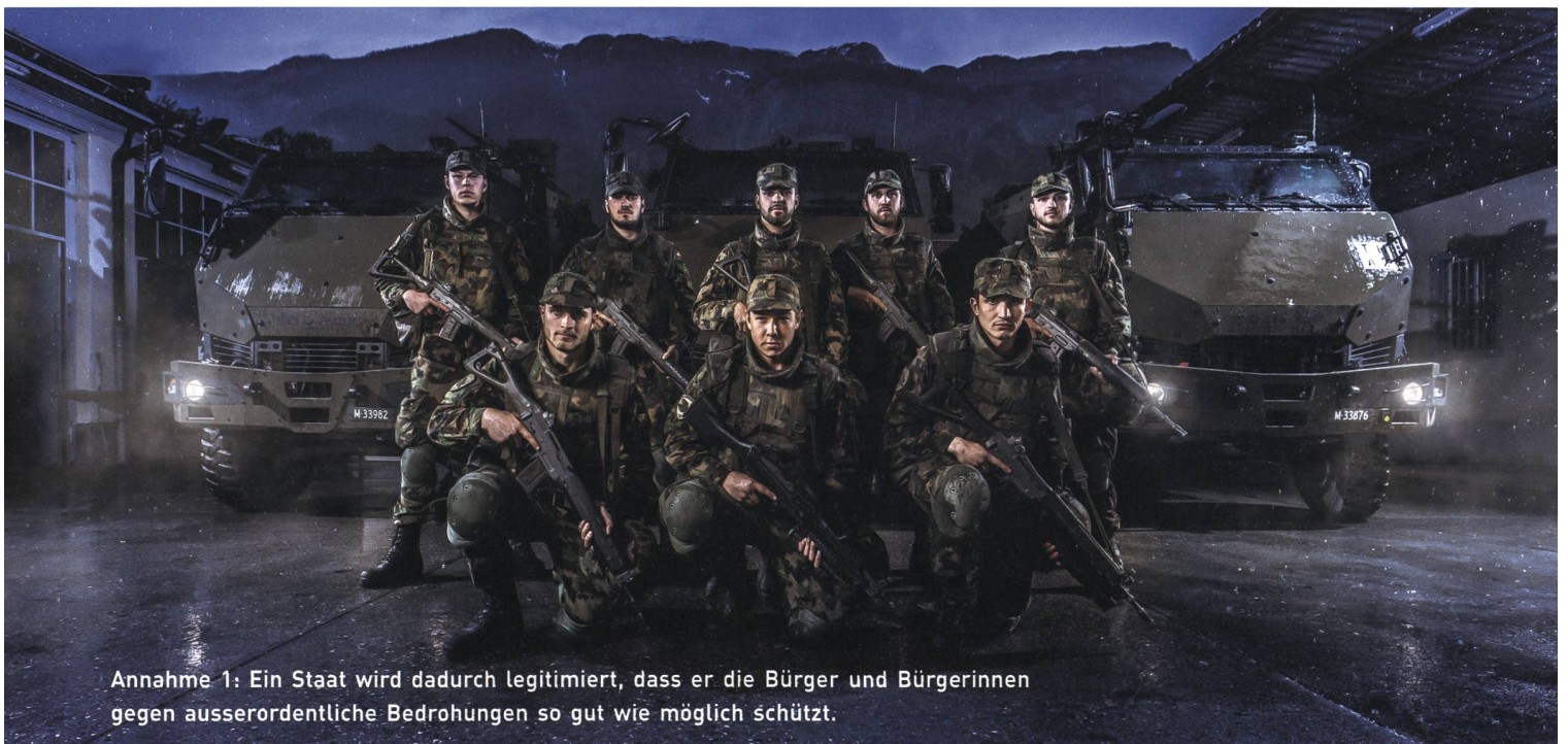
Annahme 1: Ein Staat wird dadurch legitimiert, dass er die Bürger und Bürgerinnen gegen ausserordentliche Bedrohungen so gut wie möglich schützt.

Nun zeigen wir unsere Annahmen auf, folgen drei mögliche Modelle der Zukunft der Schweizer Armee daraus und schliessen schlussendlich damit ab, welches Modell als Einziges alle Annahmen erfüllen kann.