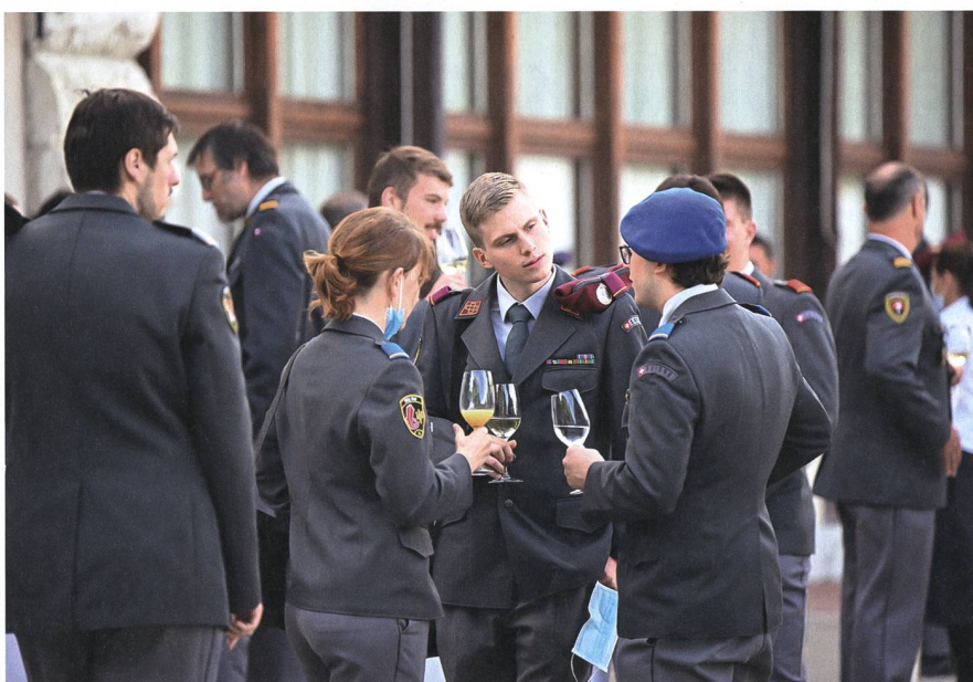
124 Offiziere wurden dieses Jahr durch ihren Heimatkanton begrüsst.