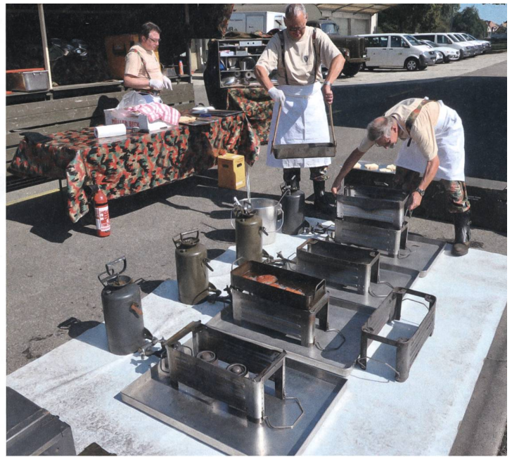
Darf nicht fehlen: Armee-Käseschnitten.