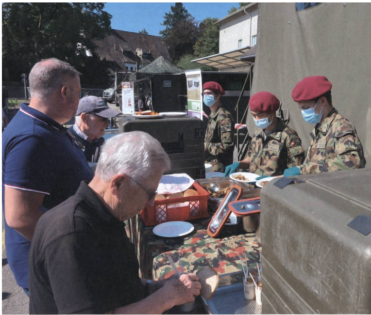
Truppenköche an der Essensausgabe.