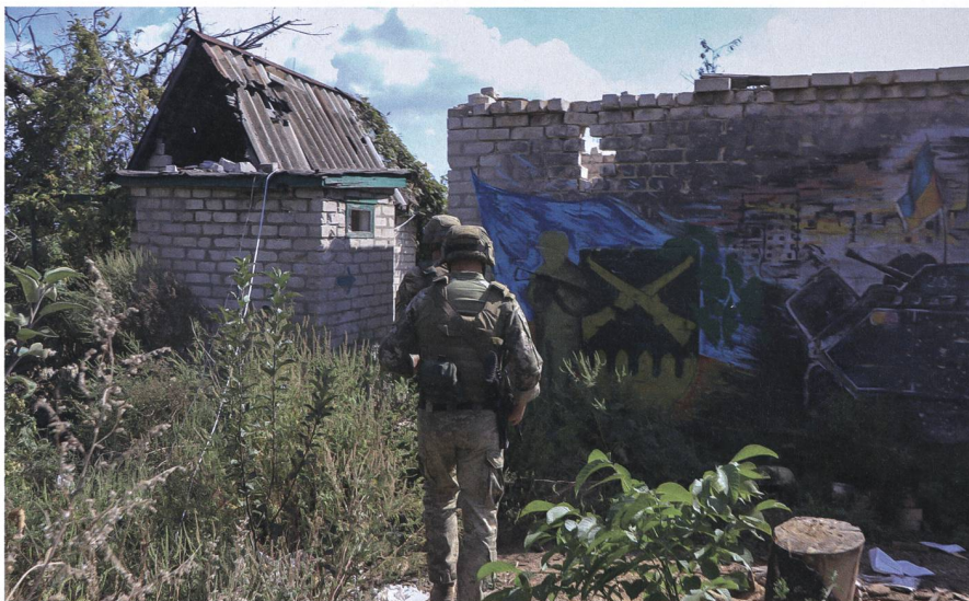
Obwohl die Feuerwaffen ruhen sollen, tobt der Konflikt in anderen Dimensionen weiter. So auch im Informationsraum.