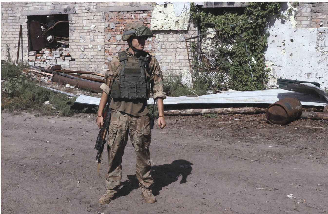
Der Kompaniekommandant: Er ist 2014 der Armee beigetreten und führt seit mehr als 2 Monaten den Einsatz vor Ort.

das bald einmal in einem Urlaub in der Schweiz zu nutzen, «wenn das Ganze hier vorbei ist».