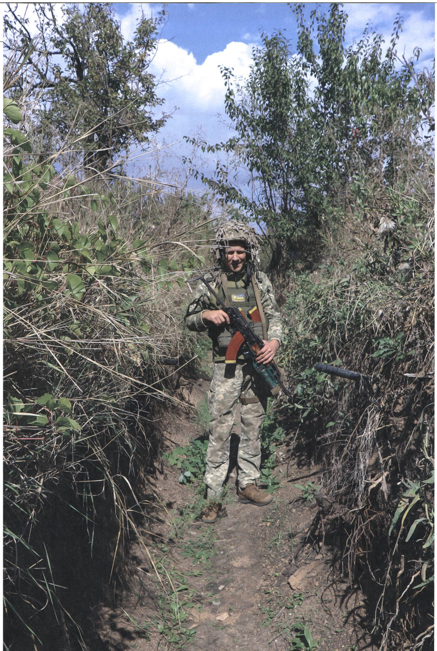
Die Fauna bietet um diese Jahreszeit einen guten Sichtschutz.

Die Bewaffnung überrascht uns. In dieser Stellung sind die Soldaten mit Sturmgewehren ohne Optik ausgerüstet. Einzig der Kompaniekommandant trägt eine Waffe mit einem Granatwerferaufsatz. Das Verbandsabzeichen lässt auf Fallschirmjäger schliessen – eine Truppe