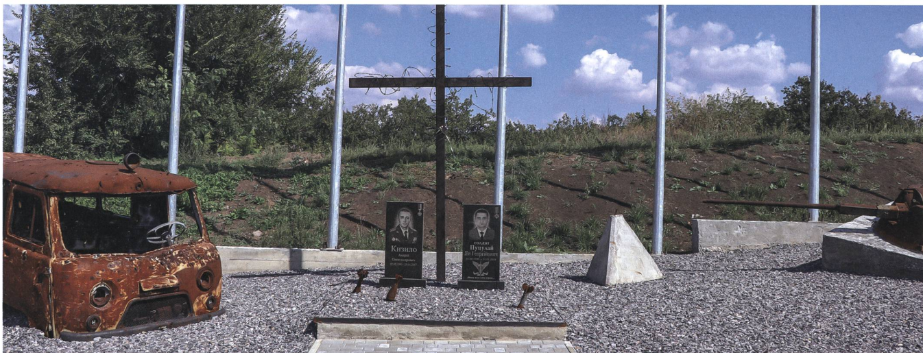
Eine militärische Gedenkstätte in der Nähe der Contact Line.