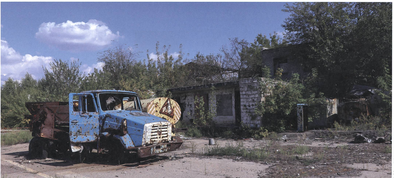
Spuren des Konfliktes. Der Waffenstillstandsvertrag will schwere Waffen und Geschütze aus der Region verbannen.