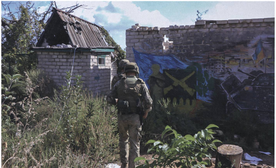
Obwohl die Feuerwaffen ruhen sollen, tobt der Konflikt in anderen Dimensionen weiter. So auch im Informationsraum.