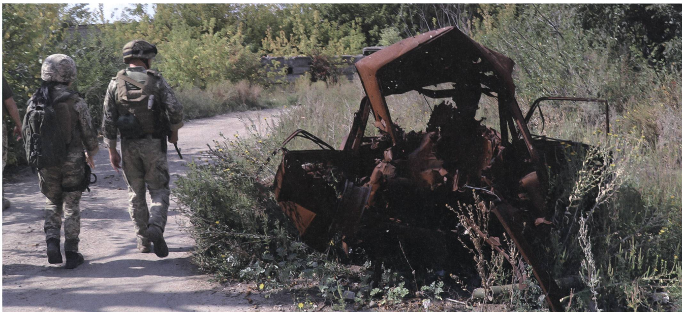
Auf dem Weg zur Contact Line. Die Minengefahr ist allgegenwärtig.

Als wir angekommen sind, schultert er sein Sturmgewehr und grinst: «Im Winter hättet ihr zu dieser Stellung rennen müssen».