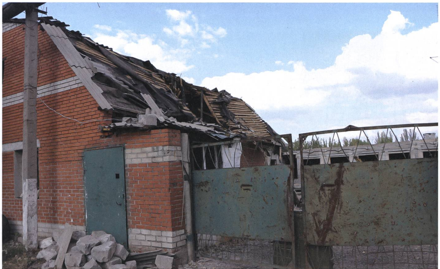
Eingang einer Grossgarage nach Beschuss durch Artillerie.

Der Kommandant wirkt jung und entschlossen. Er selbst sei 2014 in die Militärakademie in Odessa eingetreten und leiste nun seinen Dienst im Einsatz. Auch ein wenig Deutsch habe er gelernt und hoffe