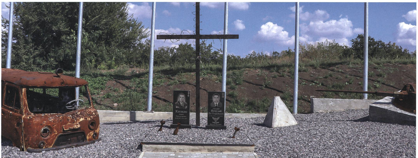
Eine militärische Gedenkstätte in der Nähe der Contact Line.