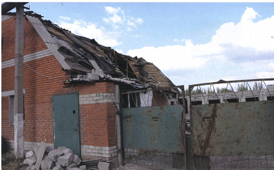
Eingang einer Grossgarage nach Beschuss durch Artillerie.

Der Kommandant wirkt jung und entschlossen. Er selbst sei 2014 in die Militärakademie in Odessa eingetreten und leiste nun seinen Dienst im Einsatz. Auch ein wenig Deutsch habe er gelernt und hoffe