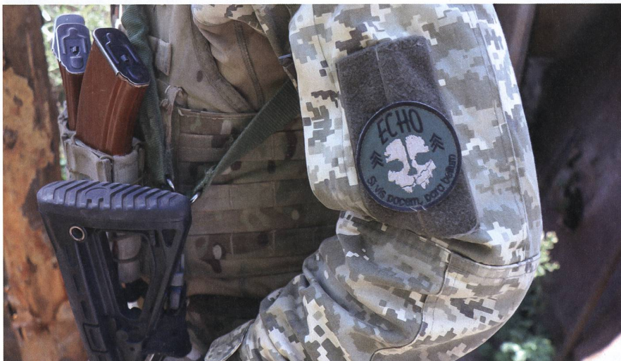
Ein Zugs-Patch mit berühmter Botschaft.

die zur Elite der ukrainischen Streitkräfte zählt.