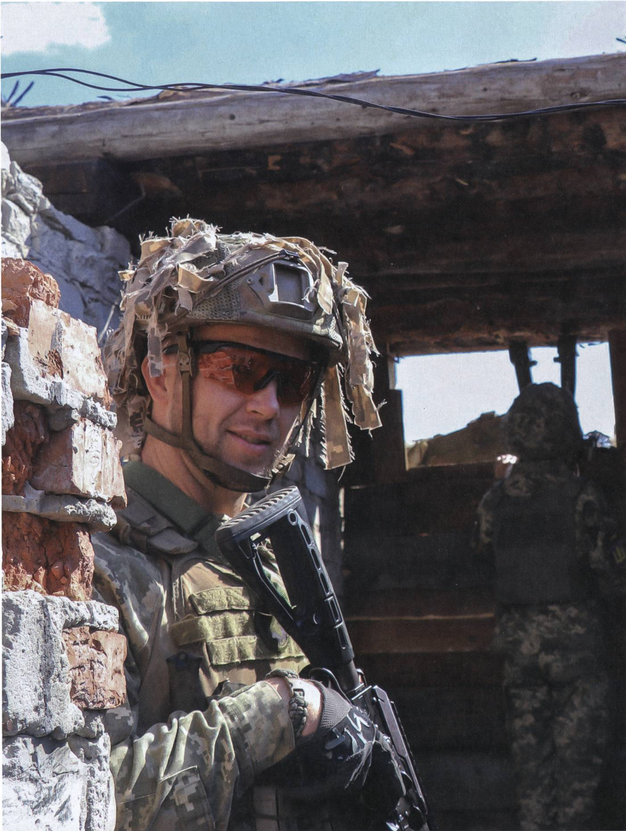
Begrüssung an der vordersten Stellung. Im Hintergrund: Beobachtung durch ein Grabenperiskop.