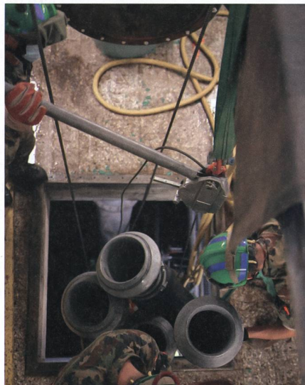
Durchdiener des Kata Hi Ber Bat beim Ausbau der Pumpen nach erfülltem Auftrag.

Die anhaltenden Regenfälle führten zu Überschwemmungen in der ganzen Schweiz. Unter anderem wurde das Dorf Cressier in Neuenburg hart von den Wassermassen getroffen. Um den Menschen vor Ort zu helfen, entsendete die Armee