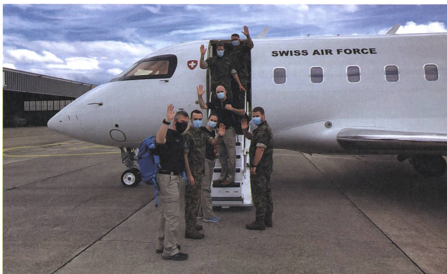
Drei Brandbekämpfungsspezialisten, zusammen mit Vertretern der Luftwaffe und des SKH/DEZA auf den Weg nach Griechenland.

Als Mitglied der DACC (Damage Assessment Coordination Cell) unterstützte er die lokalen Behörden bei der Koordination und Organisation des Hilfeinsatzes. Dazu gehörte unter anderem die