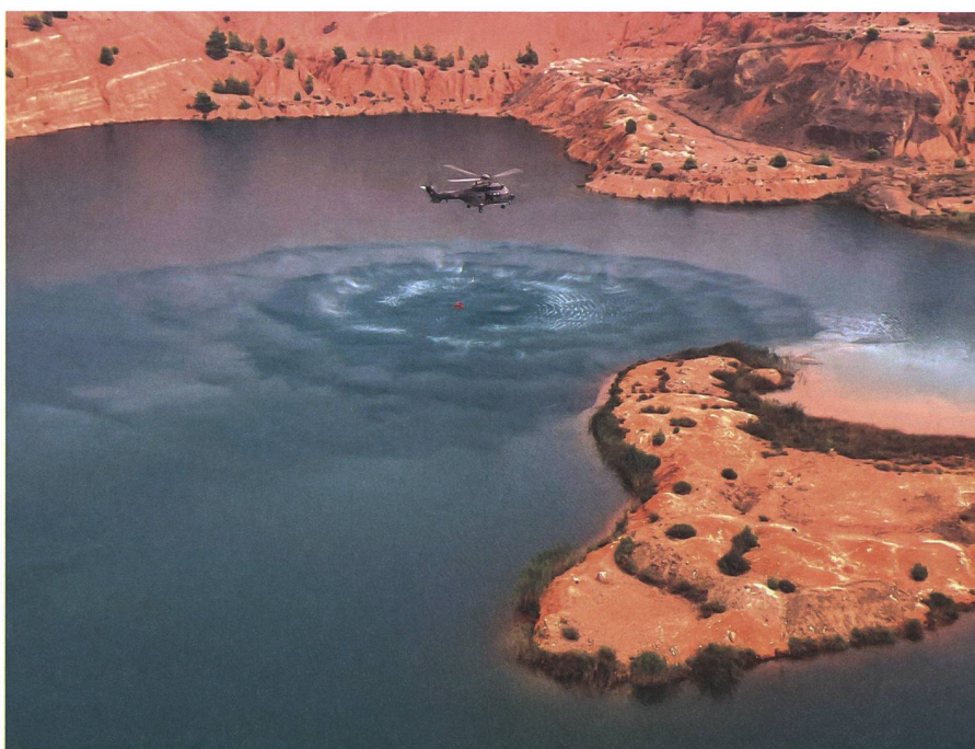
Ein Super Puma nimmt Löschwasser auf.

Beratung und Koordination der Helferinnen und Helfer vor Ort.