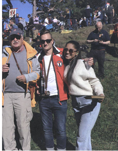
Die Pflege der Freundschaft nicht zu kurz.