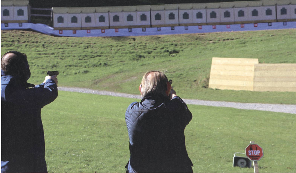
Schützen aus der ganzen Schweiz haben das Schiessprogramm auf 50 Meter absolviert.