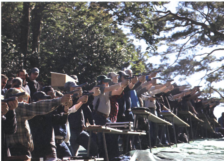
Das Historische Pistolen-Rütli-schiessen ist einer von zwei Schiessanlässen auf dem Rütli.