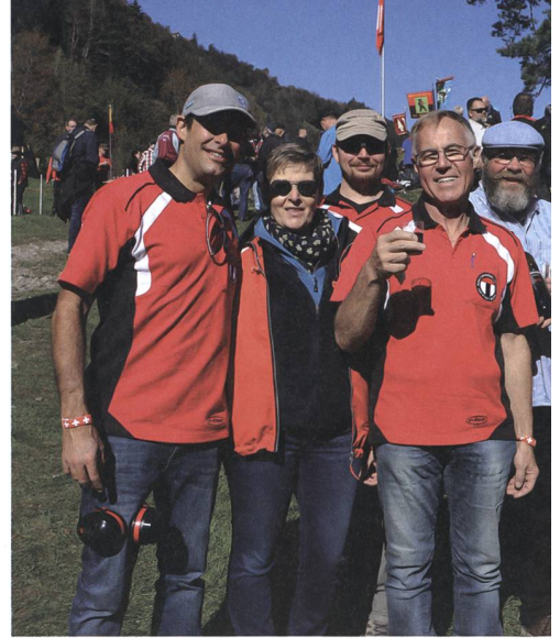
Neben dem Schiessbetrieb kam natürlich auch