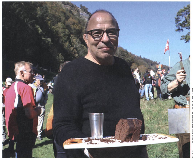
Gastfreundschaft wird bei den Schützen grossgeschrieben.