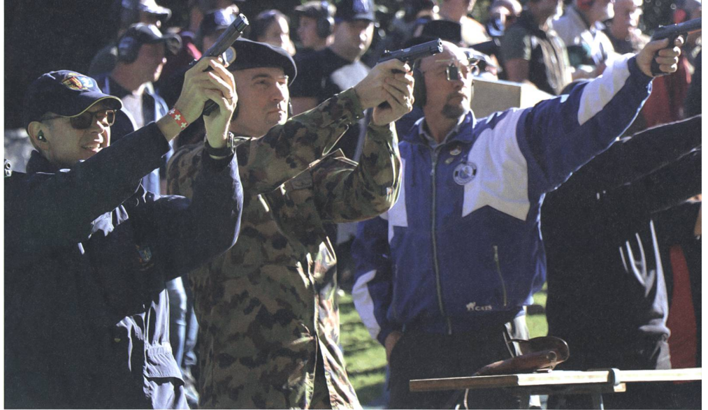
Auch der Chef der Armee nahm mit einer SIG P210 am Wettkampf teil.