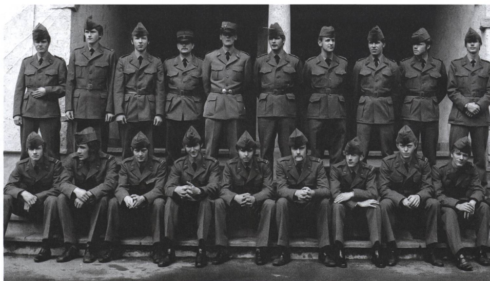
Die Fallschirmgrenadier-Rekruten des Jahrgangs 1971 mit ihren Kadern, Instruktoren und Fallschirmsprunglehrern. Damals...