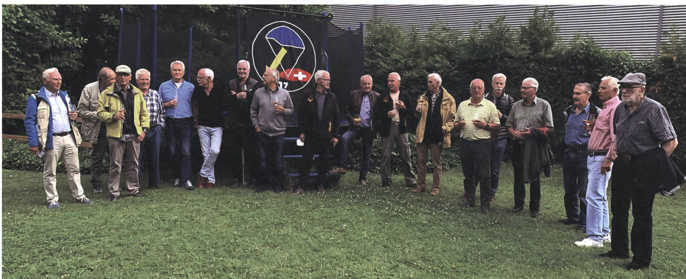
... und heute.

Denn es sind auch diese unvergesslichen Erlebnisse und Begegnungen mit Dienstkameraden, die das Leben lebenswert machen: Was über all die Jahre bleibt, das zählt! +