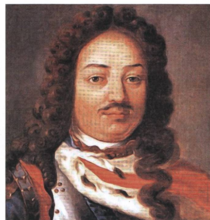
Portraitbild von François Lefort.

1688 war das Jahr der Vorbereitungen für den nächsten Feldzug gegen die Tataren. Im kommenden Februar sollte es los-