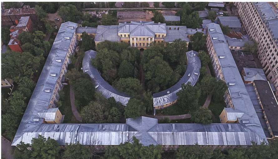
Der Lefortowo-Palast, benannt nach Lefort, ist heute das Russische Staatliche Militärhistorische Archiv.

Der alte Krieger, dessen Loyalität zu Sophia durch Peters Befehl arg strapaziert wurde, hielt Kriegsrat in der Sloboda und entschied sich schliesslich für Peter. Sophia und ihre Anhänger verliessen Moskau Richtung Sibirien. In Russland begann eine neue Ära: Peter Alexeiewitsch wurde zum «Selbstherrscher aller Reussen». ❏