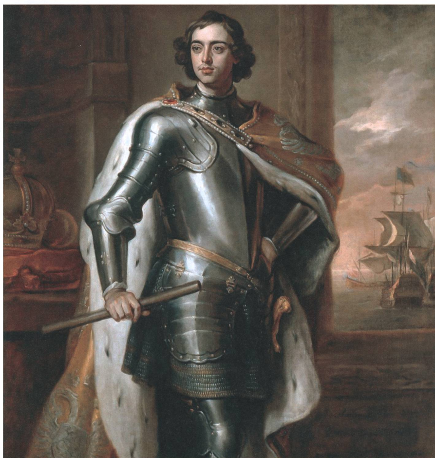
Zar Peter Alexeiewitsch (der Grosse).

Russland hatte nun zwei Zaren, von denen einer unfähig war zu regieren und der andere minderjährig. Die ältere Tochter des verstorbenen Zaren, Sophia, sah nun ihre Stunde gekommen: Mit der Unterstützung des Bojaren W.W. Golitzyns übernahm sie die Regentschaft, fest entschlossen, sie nie mehr abzugeben. Wie nicht selten in solchen Lagen kursierten sehr rasch allerlei Gerüchte in Moskau: Sophia beabsichtige, die beiden Zaren zu beseitigen und sich als Selbstherrscherin