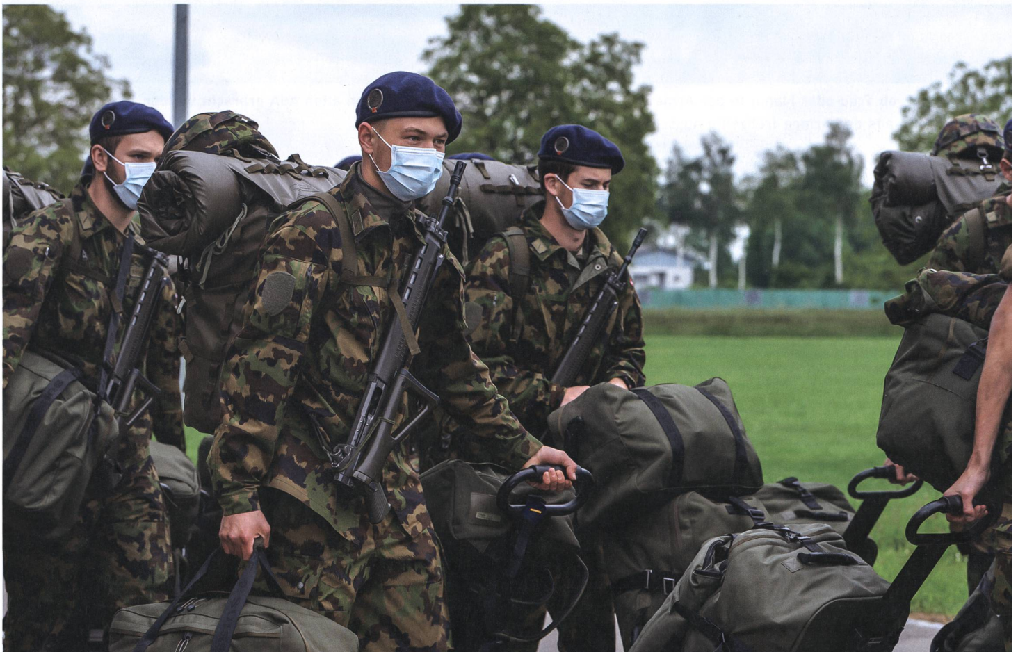
Beim amtlichen Wechsel des Geschlechts muss auch die Wehrpflicht berücksichtigt werden.

«Keine RS, früher AHV – Politiker warnen vor Trickereien mit Geschlechtseintrag», lautete der Titel eines Artikels von 20 Mi-