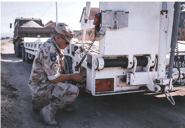
Der Einsatz des 43. Swisscoy Kontingents neigt sich dem Ende zu.