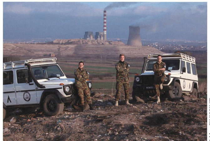
Insgesamt 4 LMT-Teams erfüllen trotz COVID-Restriktionen ihren Auftrag und suchen den Dialog mit der Bevölkerung.