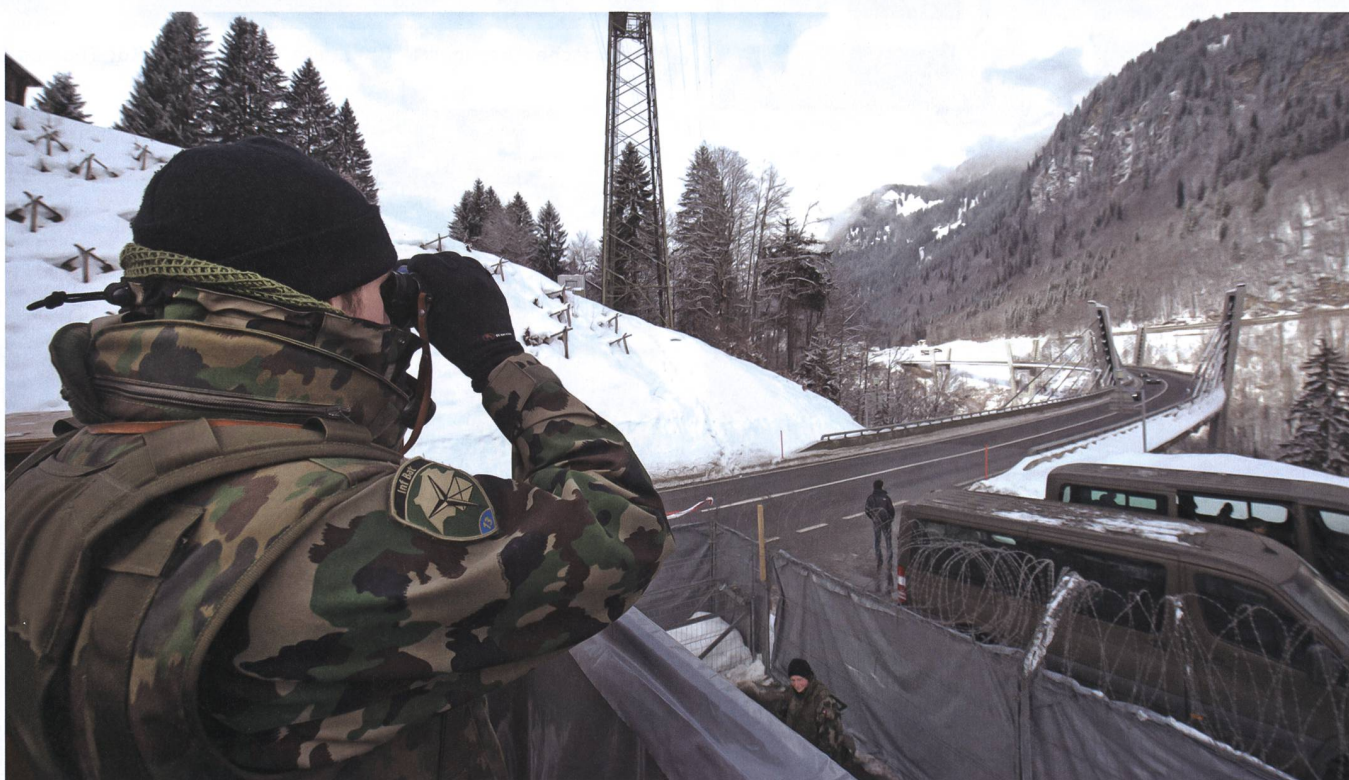
Die Kosten entsprechen einem ordentlichen WK.

Sie wird damit zur grössten Beitragsgeberin. Die Beteiligung des Bundes wird folglich von 3,675 Millionen in den Vorjahren auf 2,55 Millionen Franken pro Jahr sinken.