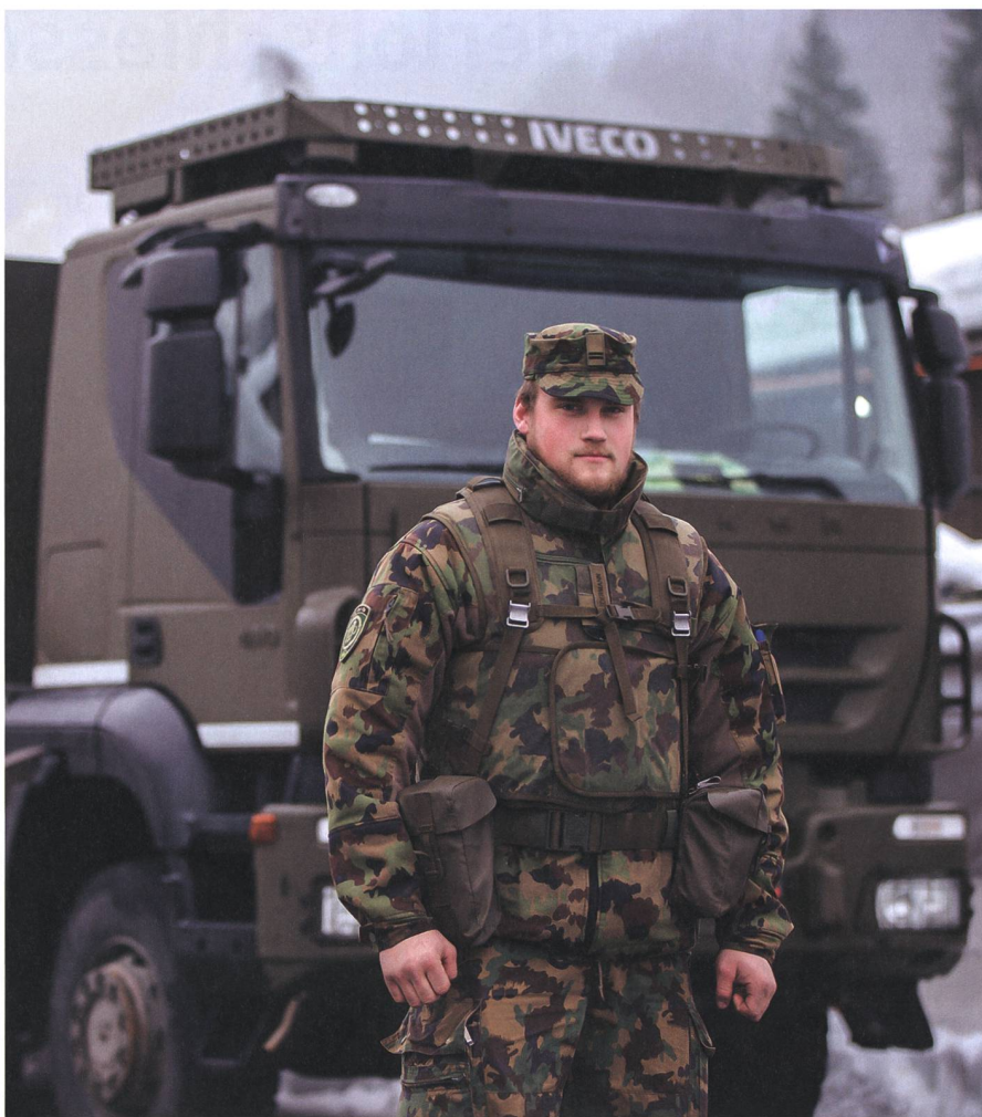
Der Nationalrat unterstützt mit 129 zu 45 Stimmen bei zehn Enthaltungen den Bundesbeschluss zum subsidiären Einsatz der Armee.

Aus diesen Gründen qualifiziert der Bundesrat das jährliche Treffen des WEF bereits seit mehreren Jahren als ausserordentliches Ereignis. +