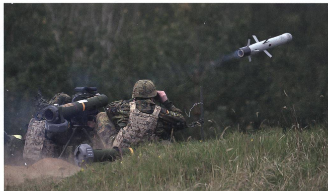
Im scharfen Schuss: Eine LR 2 wird von Infanteristen abgefeuert.