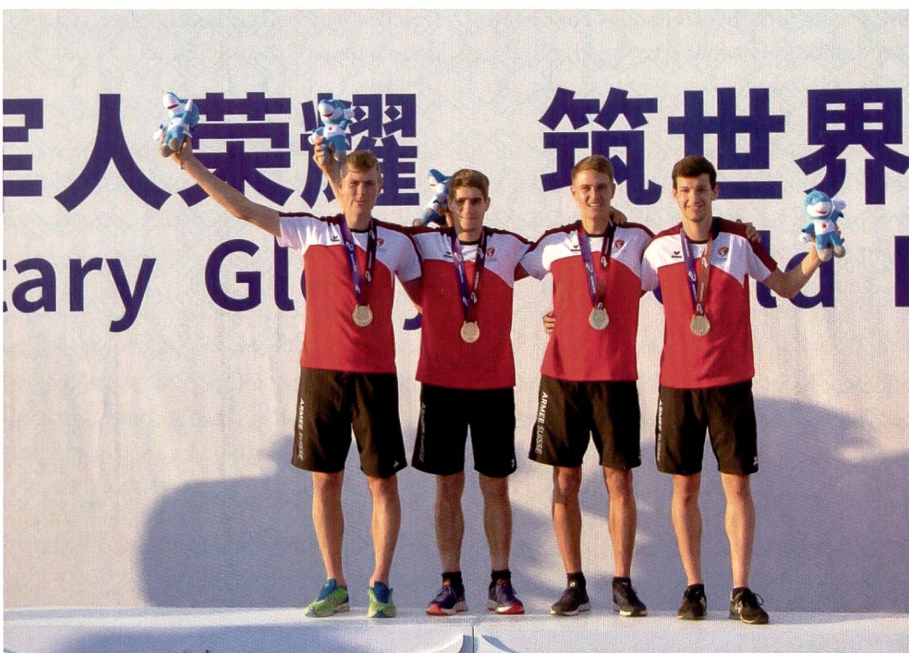
1. Rang! Erfolgreiche OL-Läufer am Militärwettkampf 2019 in Wuhan.

Cologna sagt dazu: «Disziplin ist Disziplin und der Begriff an sich ist für mich ohne zeitliche Wertung. Heute sprechen