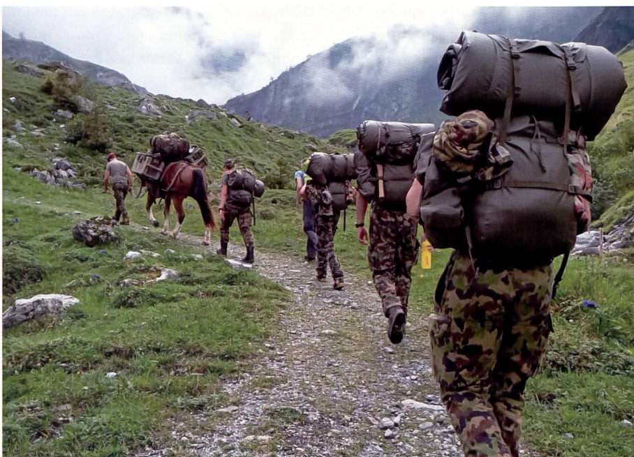
Vordetachment: Mit schwerem Gepäck den Spuren Suworows nach.