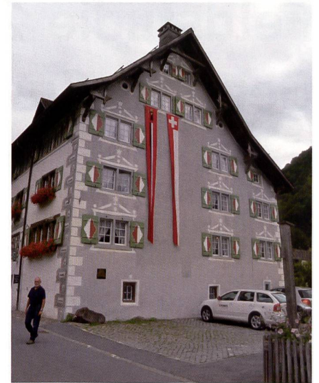
Suworow-Haus in Elm.