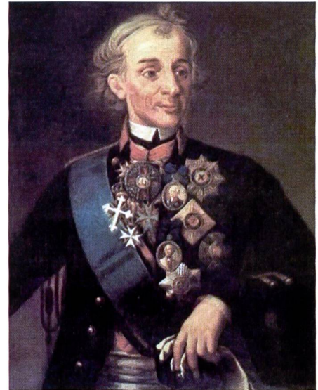
Alexander Wassiljewitsch Suworow, der russische Strategie, führte im 18. Jahrhundert einen Feldzug über sieben Alpenpässe von Norditalien bis ins Glarnerland.

Im Rahmen der Vorbereitungen aber zeigte sich im Frühjahr 2020, dass dieses Vorhaben aufgrund der Pandemie kaum im Ausland stattfinden kann und soll. Kurzerhand wurde meinem Antrag auf eine Ver-