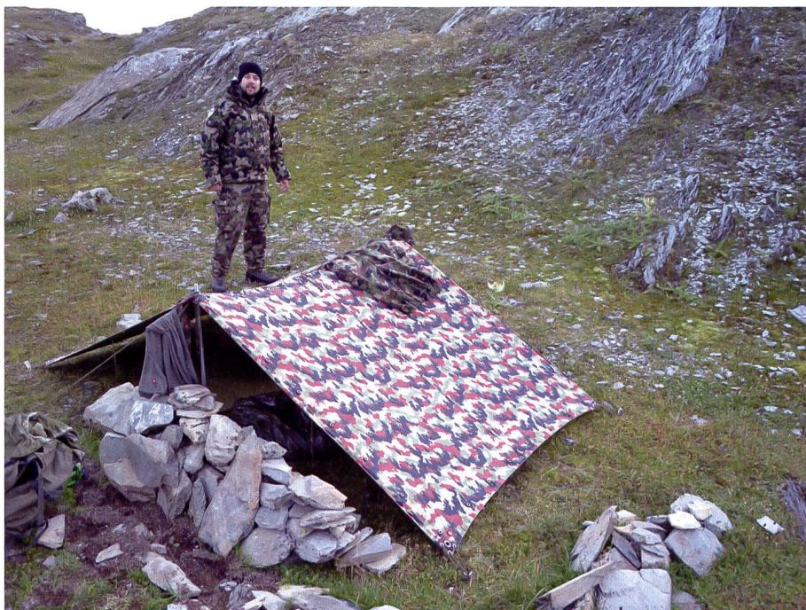
Biwak auf dem Panixer Pass, Eine Ausbildung zum Berufsoffizier schafft auch einzigartige Erlebnisse.