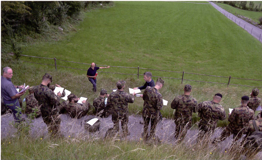
Nicht im Theoriesaal, sondern im Gelände wird das Wissen vermittelt.