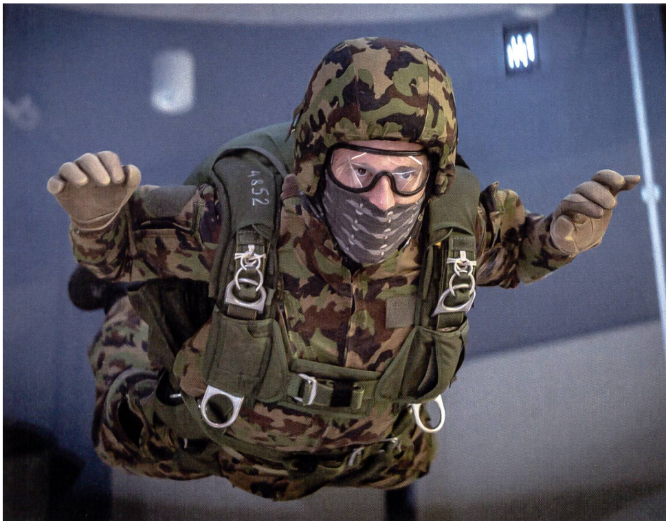
Der 90 Sekunden Flug entspricht einem Freifall aus 6000 Höhenmetern.

wusst. Er kann sich somit mit seinem Körper 3-dimensional in der Längs-, Quer- oder Hochachse drehen. Durch Armbewegungen wird eine Drehung um die Hochachse erreicht. Durch Strecken der Arme und Beine und Neigen des Kopfes kann zudem die Freifallgeschwindigkeit resp. die Flughöhe im Tunnel geändert werden. Eine ungewollte leichte Drehbewegung kann der Springer stoppen, indem er durch gezielte Hüft-, Schulter- oder Beinbewegungen oder das Einleiten einer Gegendrehbewegung wieder eine stabile Lage herstellt. Ziel ist es, im Freifall so viel Stabilität wie möglich zu erhalten. Wenn die Fluglage des Körpers nicht mehr unter Kontrolle steht, dann wird der Flug instabil. Dies kann zu extremen Trudelbewegungen und Überschlägen führen, die gefährlich und gesundheitsschädlich sein können.