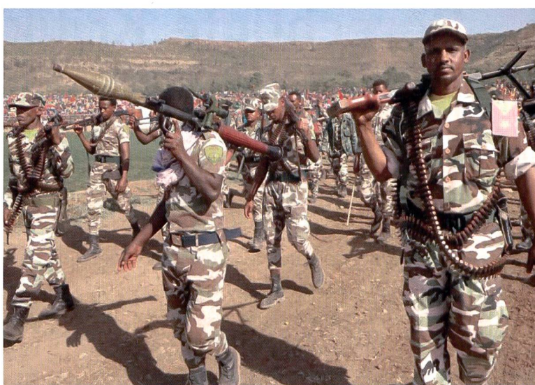
Truppen der TPLF.

sie den Beginn einer Militäroffensive zur Wiedererlangung der Kontrolle über die Region. Dabei werden als erstes die Telekommunikationsverbindungen im Konfliktgebiet unterbrochen und die Stromversorgung eingestellt.