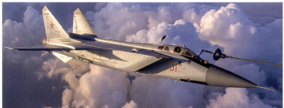
Abschluss der Kampfwertsteigerung von MiG-31BM.