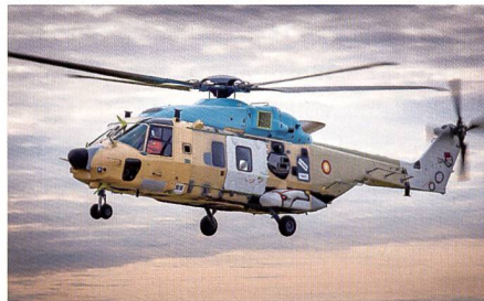
Erstflug des katarischen NH90 TTH.

Sowohl Leonardo Helicopters als auch Airbus Helicopters haben in ihren jeweiligen Werken die ersten NH90 für die Streitkräfte von Katar fertiggestellt und in die Luft gebracht. Hauptauftragnehmer Leonardo wird auch Simulatoren, Training und Maintenance für den Kunden stellen.