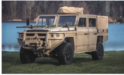
Prototyp des LAUF 20 für das KSK.

Die Schweizer Armee sucht für ihre Spezialkräfte einen Nachfolger für das 2007 eingeführte leichte Aufklärungs- und Unterstützungsfahrzeug (LAUF). In diesem Frühjahr hat das niederländische Unternehmen Defenture einen Prototyp LAUF 20 an die Beschaffungsbehörde armasuisse geliefert. LAUF 20 basiert auf dem Groundforce-Fahrzeug GRF, das Defenture nach dem Bedarf der Spezialkräfte von Heer und Marine der niederländischen Streitkräfte entwickelt hat und wel-