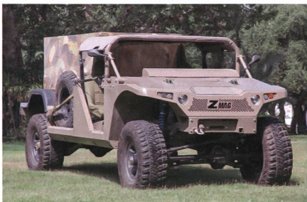
Neues taktisches Geländefahrzeug Z-MAG für die israelischen Streitkräfte.

Das israelische Verteidigungsministerium beschafft taktische Fahrzeuge des Typs Z-MAG, wie aus einer Mitteilung des israelischen Rüstungskonzerns Israel Aerospace Industries (IAI) hervorgeht. Neben den Fahrzeugen für die israelischen Streitkräfte soll der Vertrag auch Z-MAGs für einen ausländischen Kunden beinhalten. Z-MAG ist ein All-Terrain Vehicle (ATV), ursprünglich entworfen von Zibar aus Israel. Den Angaben des Herstellers zufolge ist