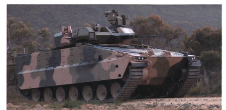
Kampfschützenpanzer Hanwha Redback.