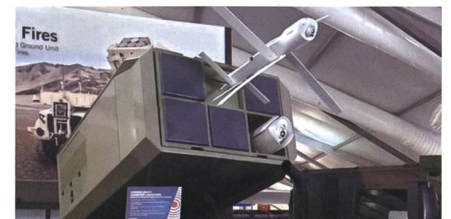
Hero 120 Loitering Munition für das U.S. Marine Corps.