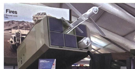
Hero 120 Loitering Munition für das U.S. Marine Corps.