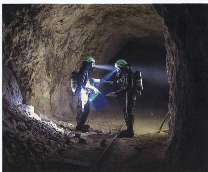
Im Rahmen der U «LABSTORM» des ABC Abw Lab 1 stellten die Infra Schutz AdA die ABC Erkundung und Kartographie des Einsatzortes sicher.

men, «nicht zuletzt, weil ich gerade den Bereich Schutz auch mit meiner Tätigkeit in der Feuerwehr verbinden konnte.