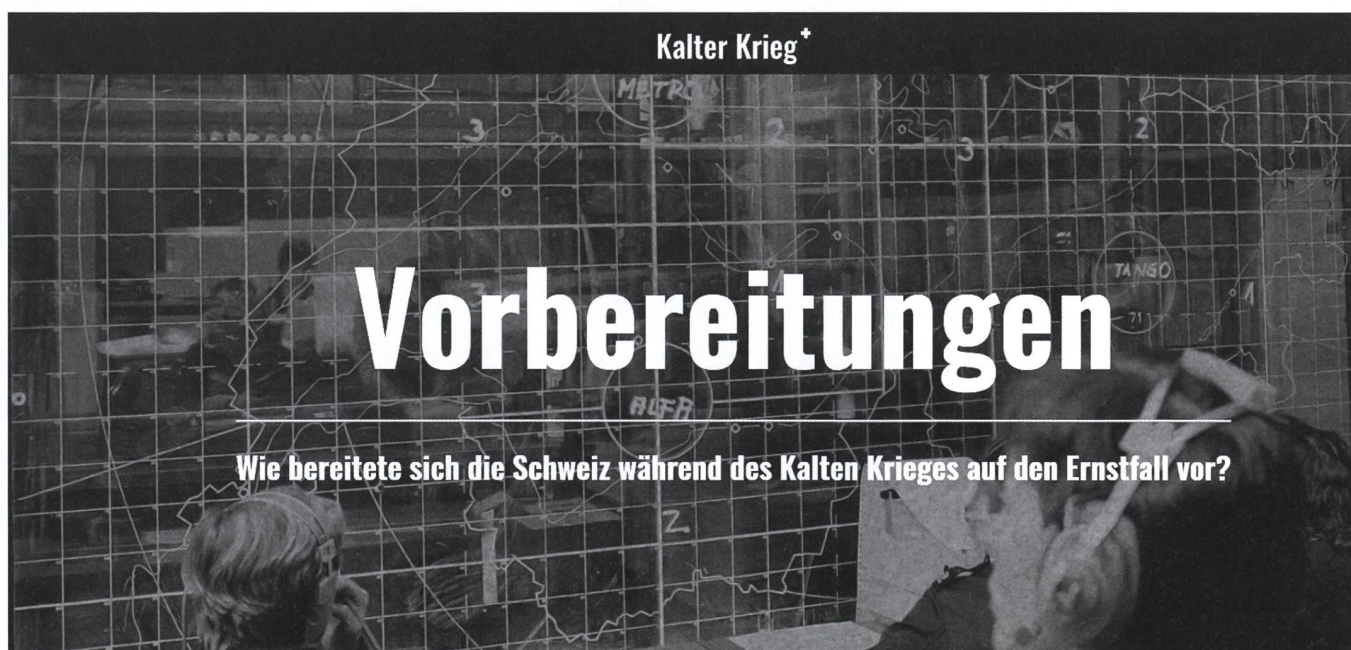
Kalterkrieg.ch: Der Kalte Krieg wird multimedial erklärt.

Die Arbeit am Projekt ist für den Neunzehnjährigen trotz der Abgabe seiner Ma-