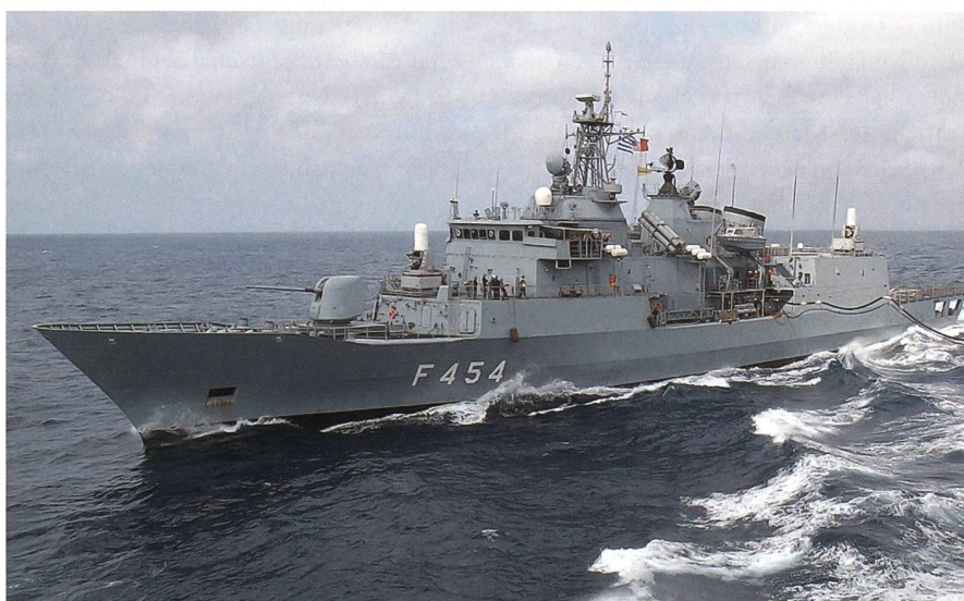
Die griechische Fregatte Psara.

Die EU hatte 2016 mit der Türkei einen Flüchtlingspakt geschlossen. Als Gegenleistung für die Rücknahme von auf den griechischen Inseln eintreffenden Flüchtlingen erhielt die türkische Regierung Milliardenzahlungen von den EU-Mitgliedsstaaten.