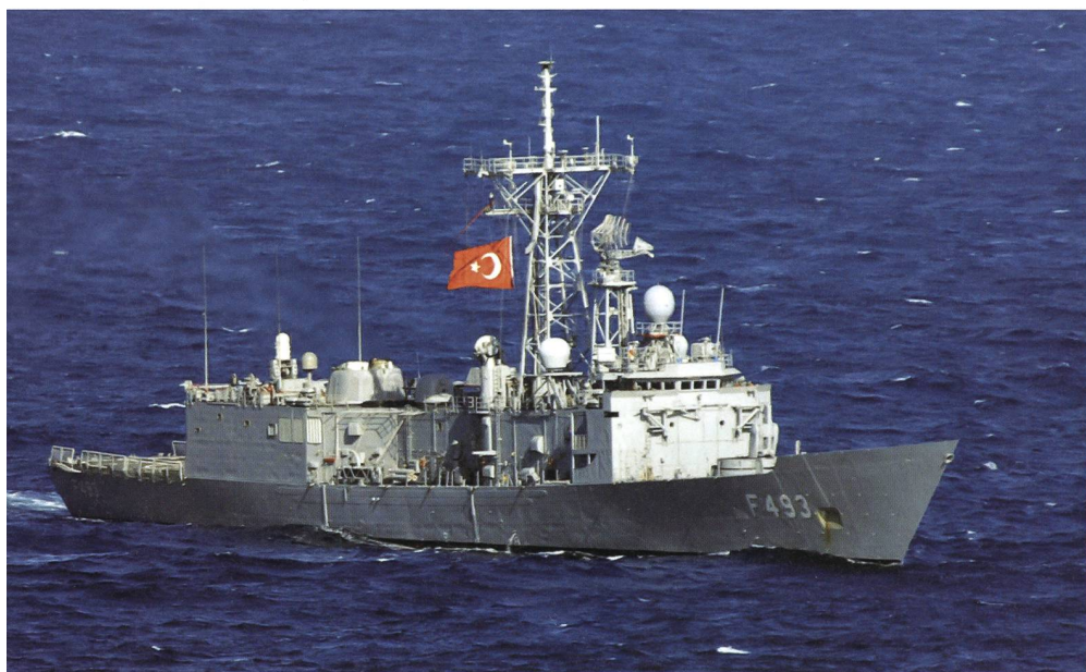
Türkische Fregatten eskortierten im Sommer 2020 Bohrschiffe über die Gasfelder des Mittelmeers.

Seit Monaten schwelt der Streit um Erdgasvorkommen im östlichen Mittelmeer. Griechenland und die Türkei beanspruchen jeweils für sich grosse Erdgasvorkom-