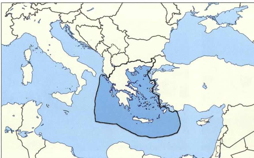
Umstrittene Wirtschaftszone Griechenlands: Ankara wehrt sich gegen diese Einzonung.

Ab Januar 2021 wollen die beiden Staaten aber wieder Verhandlungen aufnehmen. Doch der Konflikt um Gasvorkommen wird den seit Jahrzehnten bestehenden Konflikt zwischen der Türkei und Griechenland noch auf Jahre hin auf einem hohen Niveau weiterexistieren lassen und auch Konsequenzen für Europa und die EU haben. ■