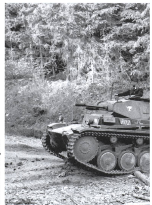
Erst durch die Bedrohung durch die Nationals eingeleitet