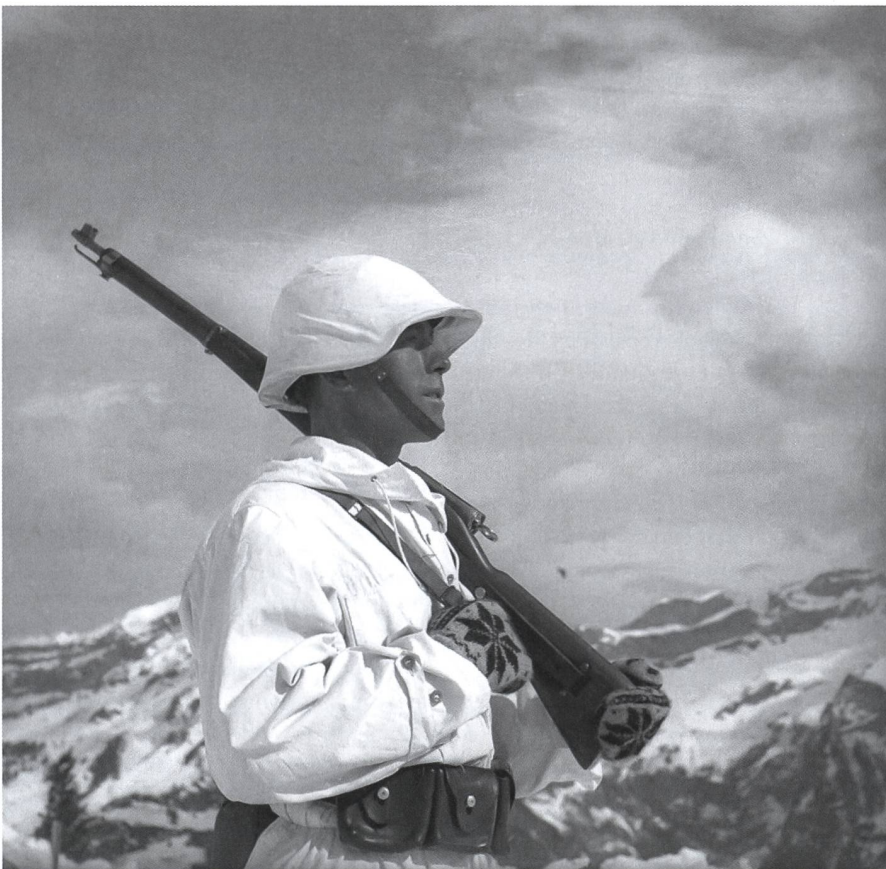
Eigenheit des eidgenössischen Wehrwillens: Karabiner 31 als persönliche Waffe.

Allerdings erreichten die seit 1936 getroffenen wirtschaftlichen und militärischen Kriegsvorbereitungen dann Ende September 1940 einen Stand, der es dem deutschen Reich nicht mehr erlaubt hätte, mit einem Einsatz der «Lörracher Feuerwehr», wie die alemannischen Nachbarn