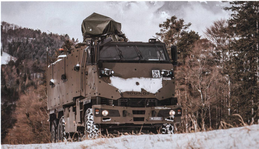
Verschiebung in das Gelände mit dem geschützten Mannschaftstransportfahrzeug.

Das Gebirgsinfanteriebataillon 48 hat seinen diesjährigen WK am Stück in der Region rund um Sargans durchgeführt und damit einen wichtigen Beitrag zu Sicherheit der Schweiz geleistet.