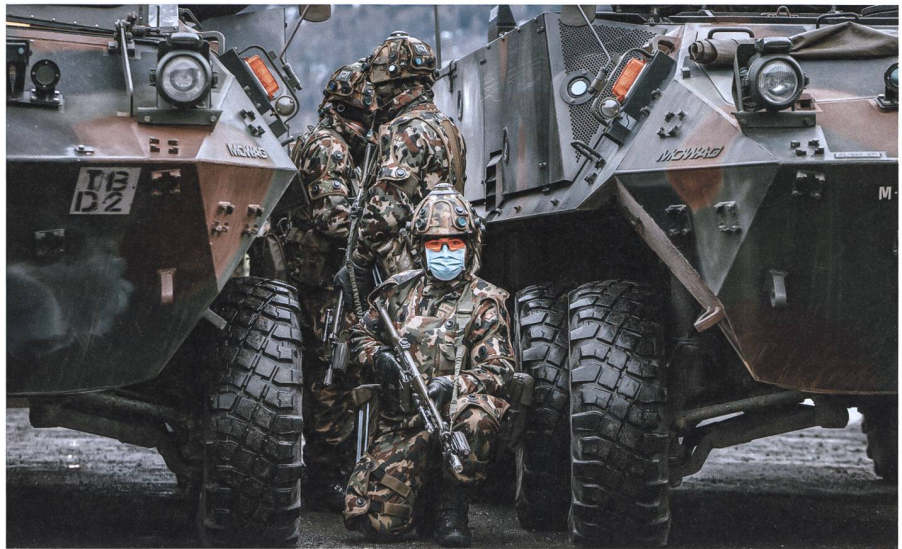
Eine Gruppe Infanteristen hält sich bereit, das Übungsdorf zu stürmen.