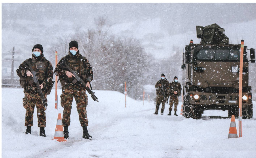
Kontrolle: Ein Checkpoint des Geb Inf Bat 48.