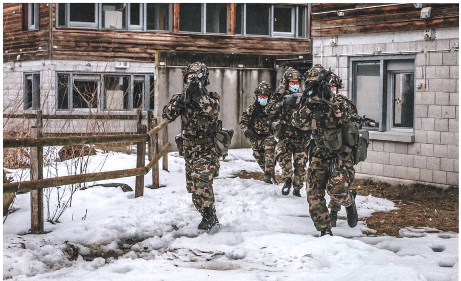
Im Angriff: Eine Gruppe stürmt ein Haus.