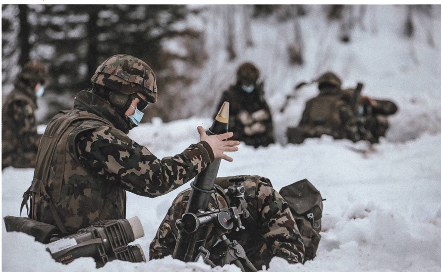
Die Kanoniere der Unterstützungskompanie feuern auf die erkannten Ziele der Späher.