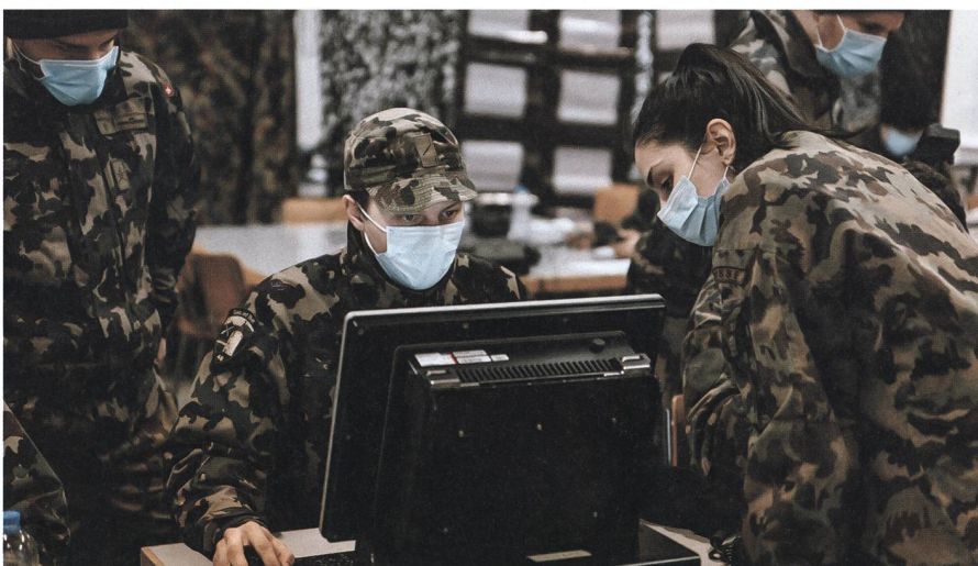
Führungsstaffel: Sie unterstützen den Kommandanten und seinen Stab indem sie die gesammelten Informationen in die digitalen Systeme und Karten eintragen.

richten beschafft, verifiziert und gesichert. Diese kann zum Beispiel im Rahmen von Unwetterkatastrophen wie z.B. Erdbeben etc. eingesetzt werden, um den zivilen Behörden schnell ein detailliertes Bild der Situation zu verschaffen. In einer zweiten Phase kann anhand der Daten eine genaue Lageverfolgung sichergestellt werden.