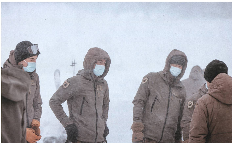
Gebirgsspezialisten lehren die Späher wie Lawinen vorgebeugt werden können.

Die Raumüberwachung war ein weiteres wichtiges Thema. Mit offenen und verdeckten Beobachtungsposten wurden Nach-