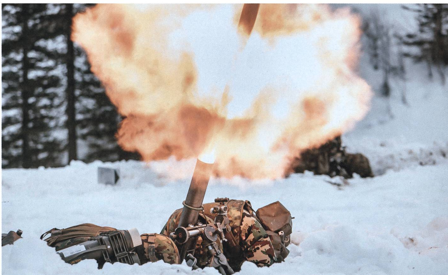
Feuer Frei: Der 8.1cm Minenwerfer feuert eine Granate ab.