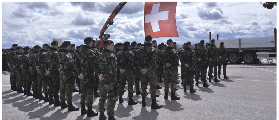
Vom Swisscoy Einsatz in den WK: Nur für Frauen.