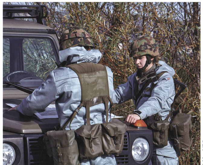
Neue individuelle ABC-Schutzanzüge.