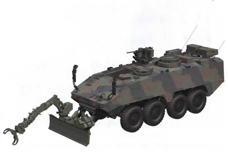
Erneuerung der Fahrzeuge für Panzersappeure. Vom M113 zum Piranha IV.