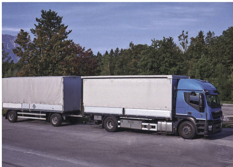
1- und 2-achsige Anhänger für Lastwagen.