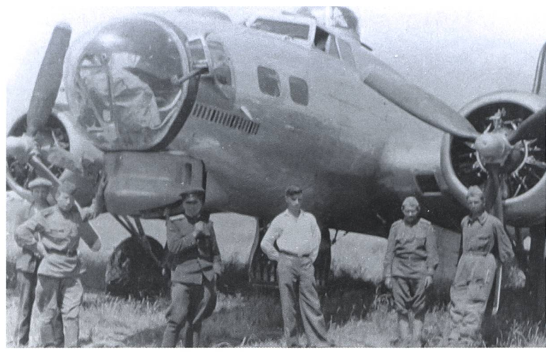
Russische Soldaten vor einer beschädigten B-17 auf dem Flugplatz Poltawa.

Italien eingesetzt und die Pendelangriffe verlieren ihre ursprüngliche strategische Relevanz. Bei den von Jagdbombern angegriffenen Zielen handelte es sich unter anderem um Eisenbahnanlagen in Rumänien. Die Analyse der Angriffe ergibt, dass der Aufwand in einem schlechten Verhältnis zur erzielten Wirkung ist. Es werden keine Frantic-Jagdbombereinsätze mehr durchgeführt. «Frantic V» und «VI» werden wieder durch die 8th AF und mit Langstreckenbomben aus Grossbritannien lanciert.