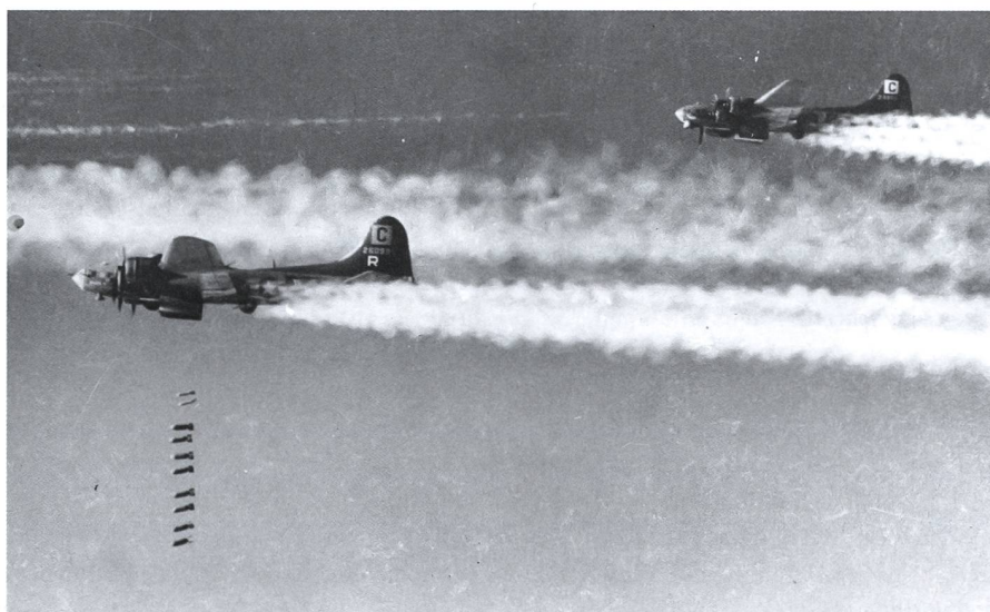
Vor allem die B-17 Flying Fortress wurden als Bomber eingesetzt.

Von den ursprünglich sechs im Februar 1944 bestimmten Flugplätzen bleiben am Ende noch deren drei übrig. Das US-