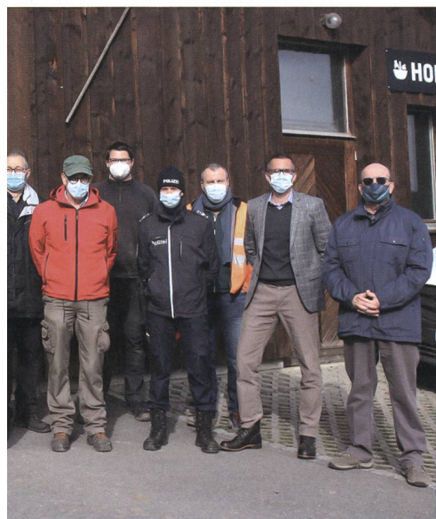
eichen Kilchberger Schwinget.

Der VUM-Einsatz der Armee wurde am 26. März 2021 beendet. Die «ganz Bösen» können nun den «Bösesten» unter ihnen erküren. Der Untergrund, der Schotterrasen, auf welchem die Sägemehlringe liegen, wird's mit Bestimmtheit aushalten. +