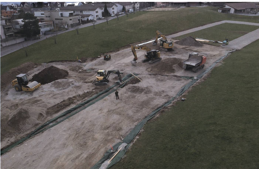
Die Armee baut im Rahmen eines VUM-Einsatzes einen Schotterrasen ein.