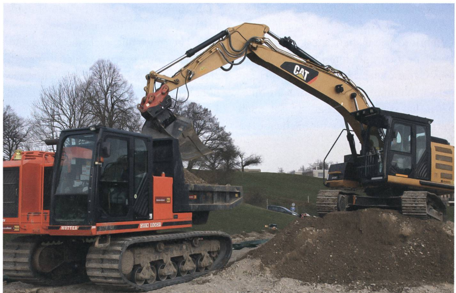
Nicht nur etwas Gutes für die Bevölkerung tun, sondern auch ein Ausbildungsauftrag: Die Baumaschinenfahrer der Armee festigen ihr Handwerk.