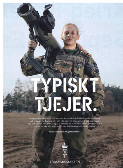
«Typisch Mädchen», Medienkampagne der schwedischen Streitkräfte anlässlich des Weltfrauentags 2021.

Moderne Arbeitszeitmodelle mit zeitgemässen Sozialleistungen sowie ein hoher technologischer Standard von Ausrüstung und Material tragen dazu bei, dass die Berufskarriere auch in den teils wohlhabenden nordischen Staaten attraktiv bleibt. Und last but not least, ein unverkrampfter, in den Schulen früh einsetzender, direkter Diskurs einer realistischen Einschätzung der vorherrschenden Bedrohungslage, gepaart mit einer Kultivierung des «Elite-Images» der Streitkräfte, lässt die Wehrbereitschaft hoch bleiben. +