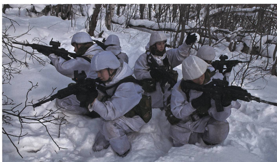
Ein unverkrampfter, in den Schulen früh einsetzender, direkter Diskurs einer realistischen Einschätzung der vorherrschenden Bedrohungslage, gepaart mit einer Kultivierung des «Elite-Images» der Streitkräfte, lässt die Wehrbereitschaft hoch bleiben.