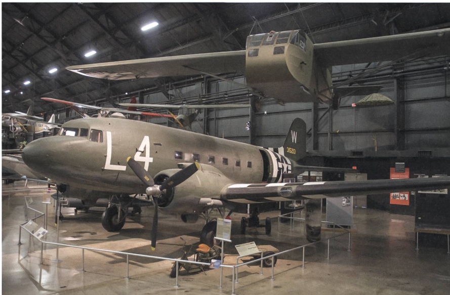
Eine C-47 Dakota und ein CG-4A Waco Lastensegler (hängend). Ein Gespann wie es in 1944/1945 zu Tausenden in den Einsatz gingen.

Luft gezogen werden. Diese Lösung erfordert erfahrene Schleppflugzeug-Piloten und grösste Sorgfalt.