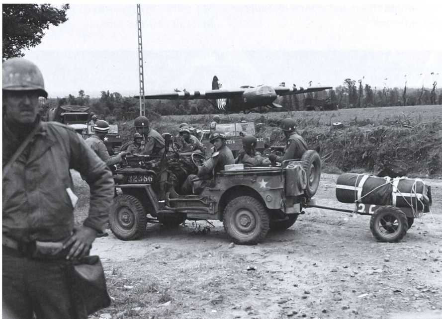
1944 Normandie: US-Soldaten vor einem britischen Horsa-Lastensegler.

Die deutsche Generalität sieht die Lastensegler vor allem vor für den schnellen, punktgenauen und überraschenden Angriff, die Bekämpfung und die Besetzung von wichtigen Zielen, wie Brücken, Befestigungen oder Knotenpunkten. Die