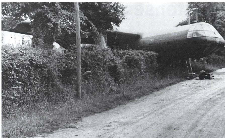
1944 Normandie: Viele Lastensegler gingen bei der Landung zu Bruch.

Sowjets hingegen möchten die Lastensegler für grosse Operationen hinter dem Rücken des Feindes einsetzen. Da jedoch ihre Luftwaffe über zu wenige leistungsfähige Schleppflugzeuge verfügt, kommt es im Verlauf des Krieges zu vergleichbar wenigen Einsätzen sowjetischer Segler.