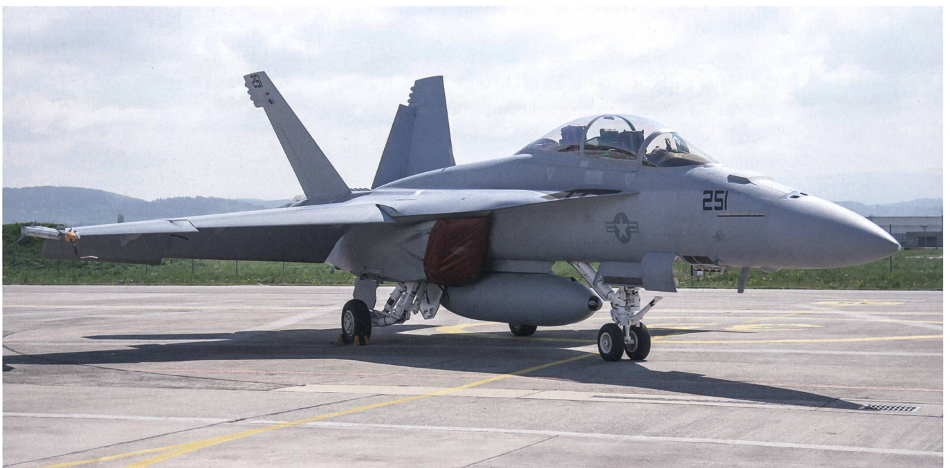
F/A-18 Super Hornet, Boeing.

Unter dem Titel «Welchen Einfluss hat [sic] die USA?» wird vom Datenaustausch gewarnt. «Mit der stark ausgebauten Kommunikation zwischen verschiedenen militärischen Systemen besteht die Gefahr, dass die Schweizer Flugzeuge in Zukunft nicht nur zum Schutz des Schweizer Luftraums eingesetzt würden», lautet das vollständige Argument. Die beschriebene Verbindung trifft allerdings auf jedes