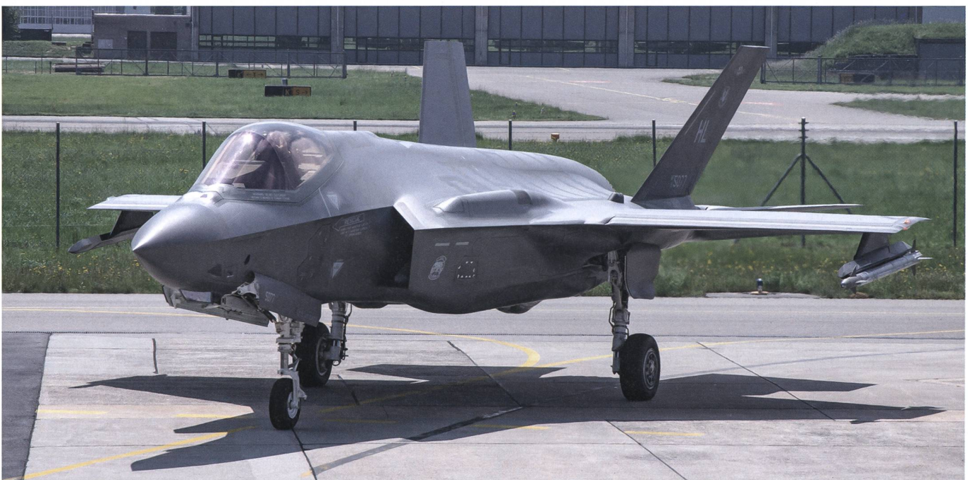
F-35A, Lockheed Martin.