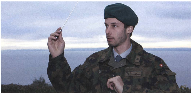
Die Offiziere (Spielführer) der Militärmusik üben eine einzigartige Doppelrolle in der Armee aus.