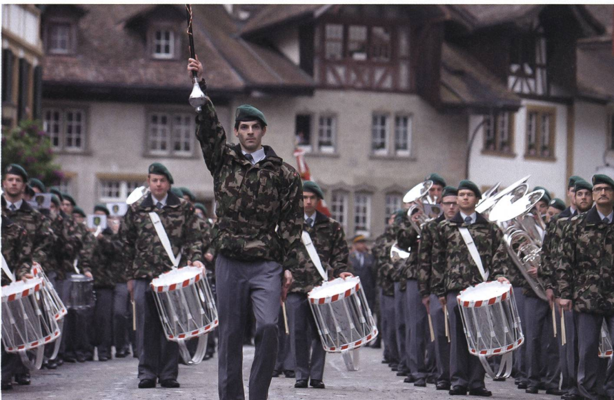
Brücke zwischen Armee und Volk sowie Förderer der nationalen Kultur: unsere Militärmusik.