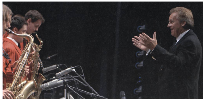
Schweizer Milizprofis – International angesehen. Die Swiss Army Big Band 2007 unter der Leitung von Pepe Lienhard.