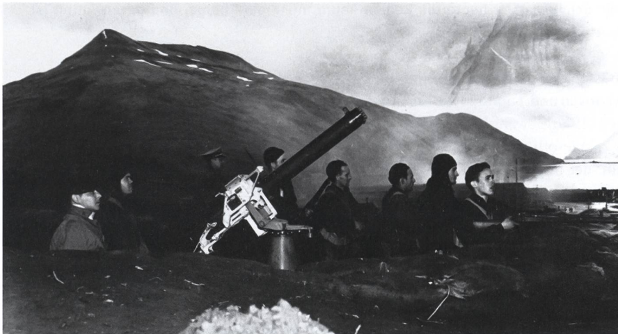
3. Juni 1942, Dutch Harbor, Aleuten. Die Crew einer Maschinengewehrstellung beobachtet die abfliegenden japanischen Kampfflugzeuge. Im Hintergrund der Rauch der von japanischen Sturzkampfbombern in Brand geschossenen SS Northwestern.

Text: Major Kaj-Gunnar Sievert