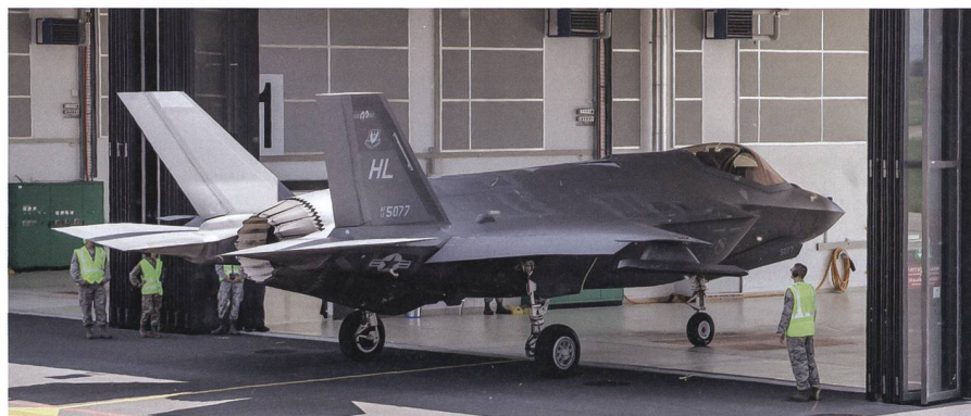
Bis zur Armeebotschaft 2022 und darüber hinaus gilt es nun, an der Basis Überzeugungsarbeit zu leisten und geschlossen die Beschaffungsvorhaben zu unterstützen.