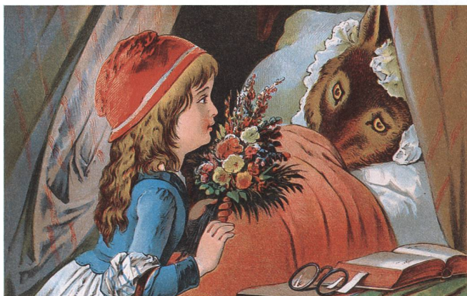
Das Märchen ist eine Fundgrube für listiges Verhalten. Der Wolf verkleidet sich als Rotkäppchens Grossmutter.