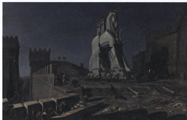
Eine klassische List, die bis heute bekannt ist: Das Trojische Pferd.