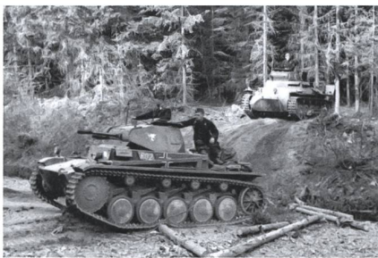
Auch in der Kriegsführung des 20. Jahrhunderts sind berühmte Listen entstanden. In Operation SICHEL-SCHNITT überraschten Panzer der Wehrmacht, aus den Ardennen kommend, die französische Verteidigung.

Seit Urzeiten tragen die Menschen untereinander Konflikte mit Gewalt aus. Seit der Bildung von Hochkulturen werden diese durch den Einsatz der List unterstützt. Mit Täuschungen und Überraschungen versucht man, den gegnerischen König oder Heerführer auszutricksen und zu besiegen. Vor allem, wenn der Gegner zahlenmässig überlegen war, machte man