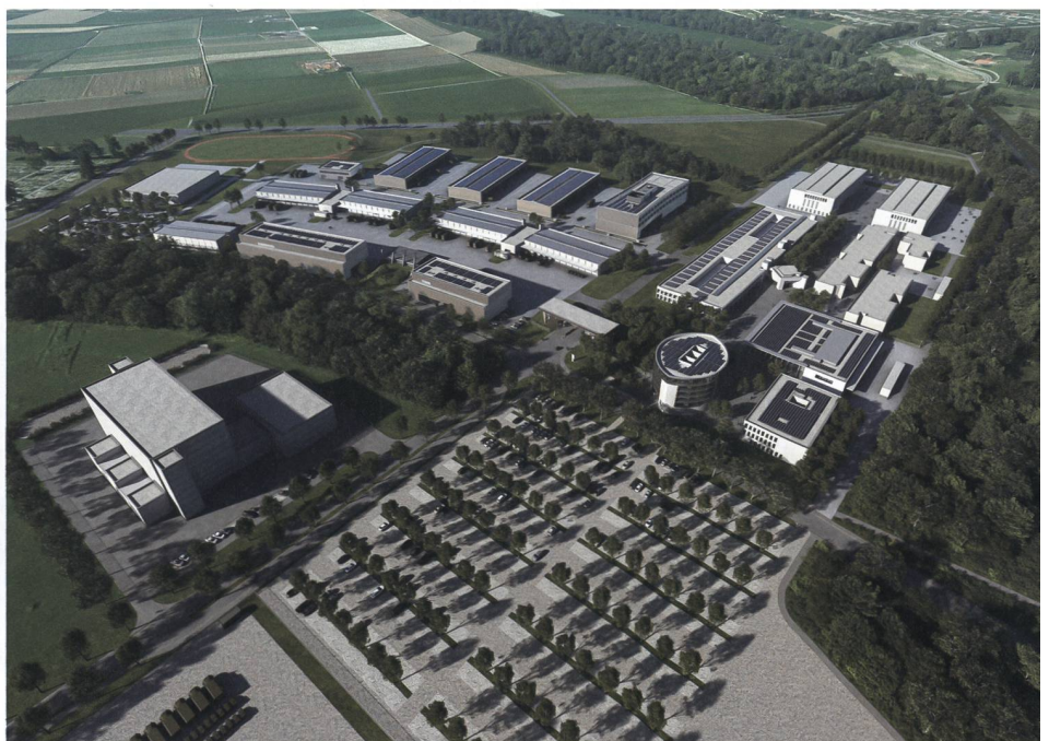
Illustration der dritten Bauetappe. Zwischen 2022 bis 2024 wird ein Neubau einer Ausbildungshalle und eines Unterkunftsgebäudes mit 600 Betten sowie die Sanierung des Kommandogebäudes realisiert.

Im Immobilienprogramm VBS, einem Teil der Armeebotschaft 2021 stimmte der Nationalrat am 8. Juni 2021 der dritten Bauetappe in Frauenfeld zu. Der Ständerat wird die Armeebotschaft 2021 in der