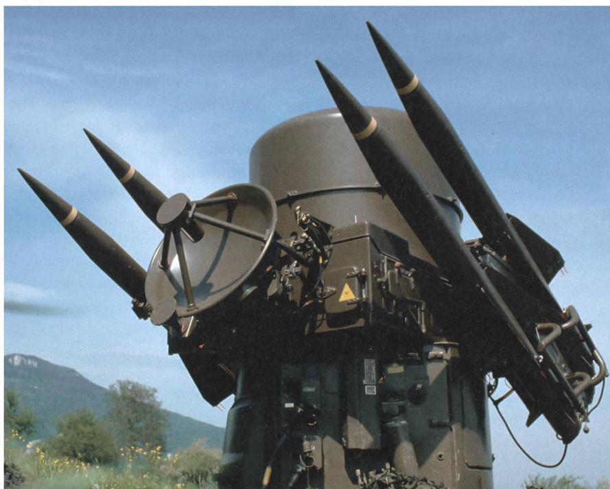
Waffensystem Rapier: Noch bis Ende 2022 einsatzbereit.