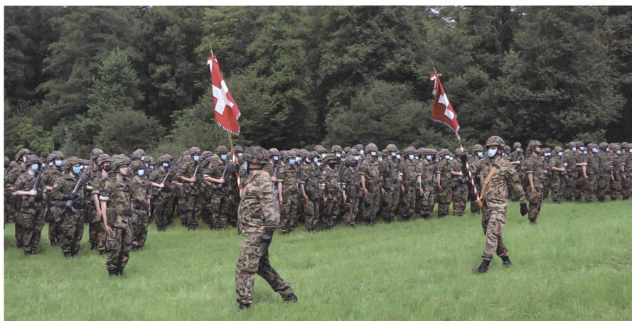
Wie geht es weiter? Offiziere und Höhere Unteroffiziere leisten später Dienst in einer anderen Formation der Armee (z.B. Übermittlung). Unteroffiziere und Mannschaft mit mehr als 35 Dienstoffizieren werden umgeschult.