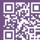
Weitere Informationen helvetia.ch/marder