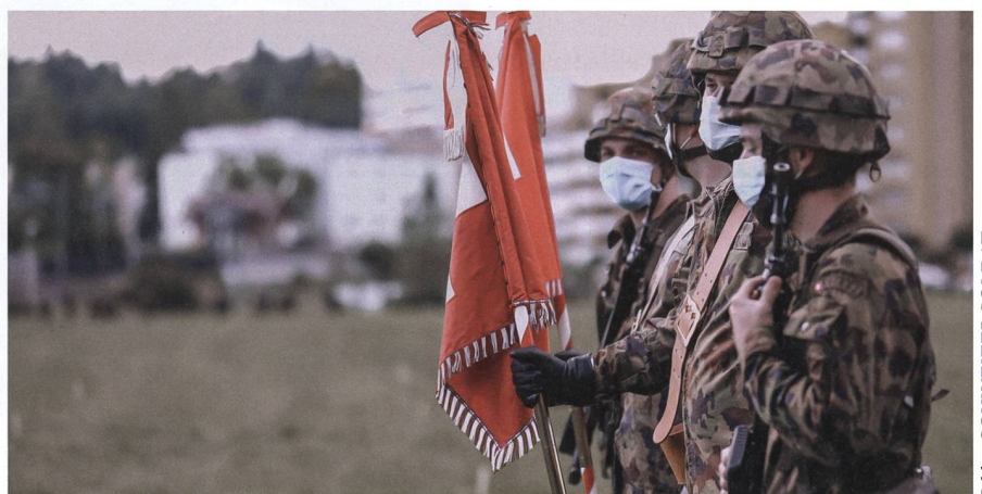
Die Mobile Fliegerabwehrlenk Waffen-Abteilung 411 tritt den Dienst mit 600 Mann aus den zwei fusionierten Abteilungen 4 und 11 an.