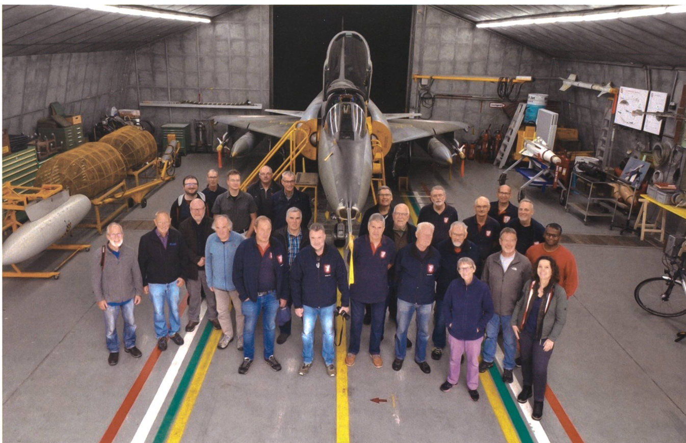
Der Mirage-Verein Buochs hat sich zum Ziel gesetzt, die 40 Jahre dauernde Ära des erfolgreichen Kampfflugzeuges MIRAGE III in der Schweiz in bescheidener materieller, vor allem aber in ideeller Form weiterzuführen.

und insgesamt neu 7500 Schweizer Franken pro Jahr auf die Seite stellen», erklärte Borgeaud. Dies sei ein existenzgefährdender und unsicherer Weg für den Verein.