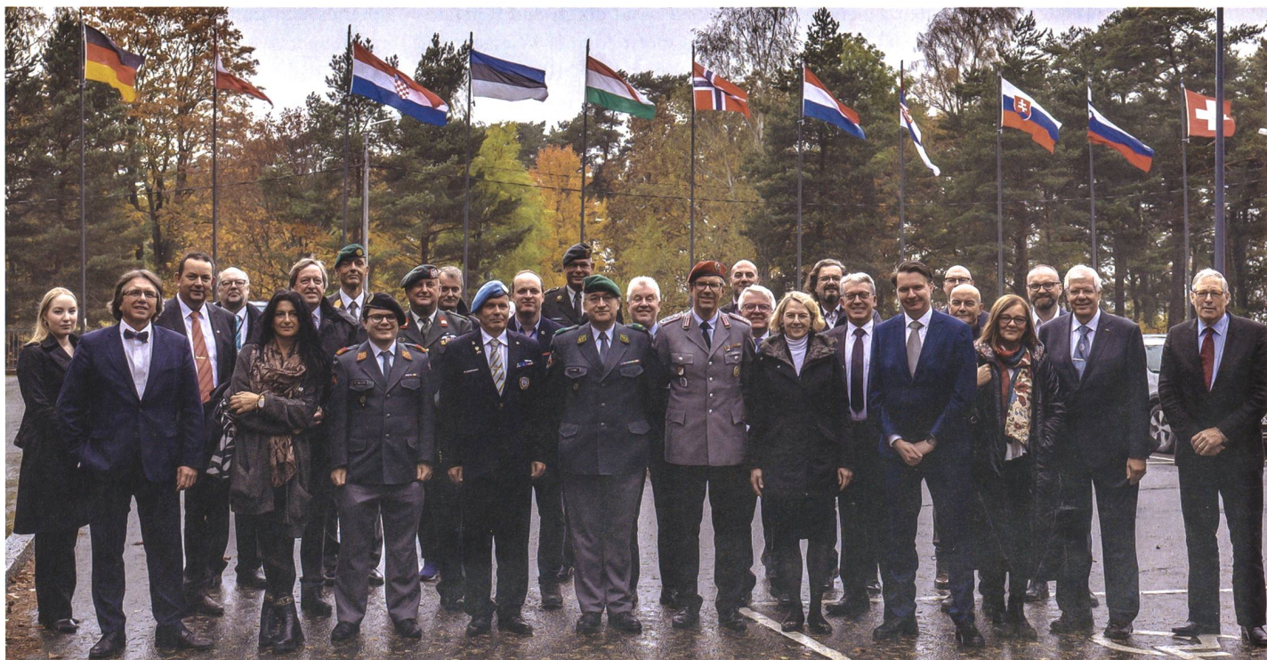
Über 30 Vertreter der wichtigsten Medien im Bereich Verteidigung und Militär aus 10 Ländern reisten an den diesjährigen Kongress nach Finnland.

Vor Ort wurde den EMPA-Mitgliedern vor allem die modernisierte Ausbildung