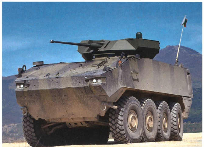
Der hochmobile und leistungsstarke PIRANHA hat alles, was von einem modernen, multifunktionalen Fahrzeug verlangt wird.

Kantons Thurgau. Entsprechend wichtig sei das Unternehmen daher für den Nachwuchs in zahlreichen Berufen, so Engeli. Ausserdem biete das Unternehmen zusätzlich Arbeit für mehr als 1000 indirekt Beschäftigte in der Schweiz. Innerhalb des gesamten General-Dynamics-Konzerns sei die Firma GDELS – Mowag mit Standort Kreuzlingen das Kompetenzzentrum für Radfahrzeuge. Wobei die Kernkompetenzen in den Bereichen Antrieb, Schutz und Systemintegration liegen. Rund 60 Prozent der Mitarbeiter sind in der Produktion eingesetzt, 14 Prozent in der Entwicklung und Forschung und acht Prozent im Kundendienst. Der Rest entfällt auf die Bereiche Marketing, Vertrieb, Finanzen und Administration. Bereits wurden 18 700 Fahrzeuge in die ganze Welt verkauft, eine eindruckliche Zahl, wie ein Teilnehmer fand.