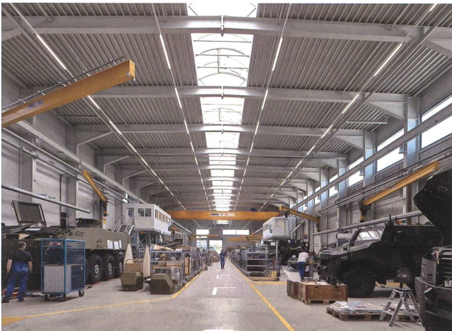
Die Offiziersgesellschaft Zürcher Unterland besuchte im Oktober die Produktionsstätte der GDELS – Mowag.