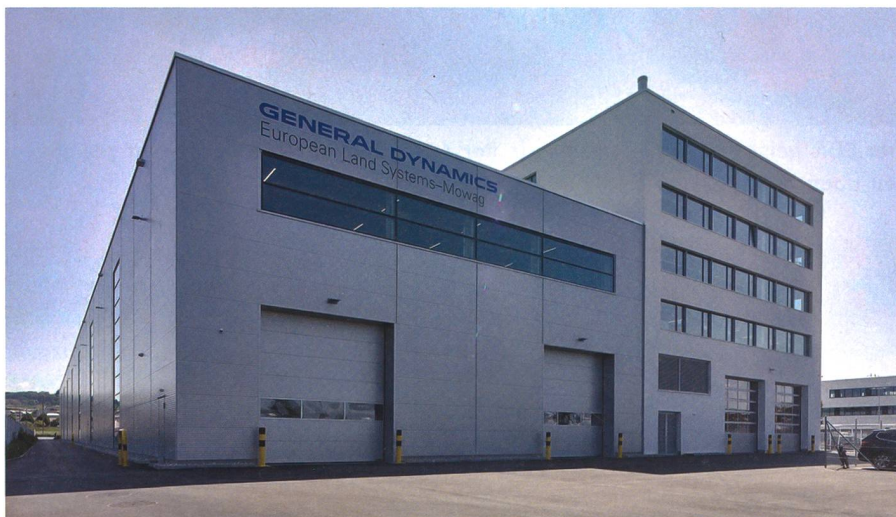
Mit 800 Festangestellten und ca. 50 Lehrlingen ist die GDELS - Mowag GmbH einer der führenden Lehrlingsbetriebe des Kantons Thurgau.

Mit 800 Festangestellten und ca. 50 Lehrlingen ist die GDELS - Mowag GmbH einer der führenden Lehrlingsbetriebe des