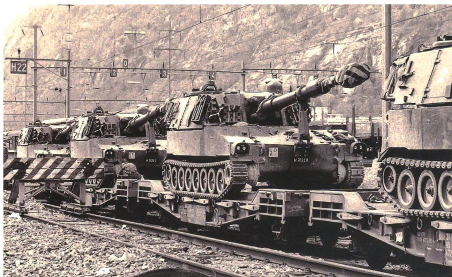
Der Bahnverlad wurde oft geübt und gehörte in jedem WK zur Routine. Hier werden die Geschütze der Pz Hb Abt 10 auf dem Bahnhof Brig für den WK 1988 im Simplongebiet entladen.

Schliesslich müsste man sich das erwähnte Argument der Verwundbarkeit auch dort stellen, wo wir weiterhin auf festen Einrichtungen und Infrastrukturen basieren und diese auch nicht stilllegen können (Regierungsgebäude, Flugplätze, Führungszentren, Verwaltungszentren, Logistikzentren, Verkehrs- und Übermittlungsknotenpunkte, Kraftwerke, usw.).