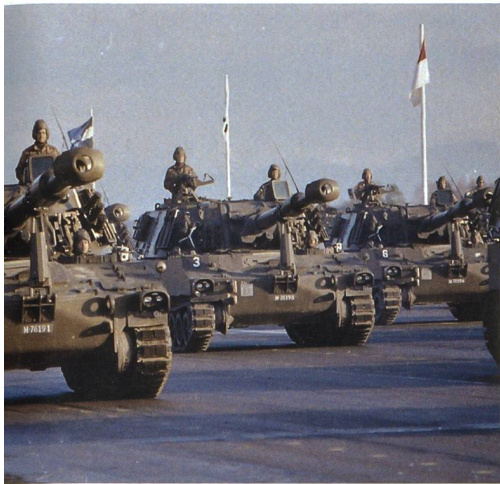
grösseren Publikum am Défilé von Truppen vorgeführt.

Eine Palette mit acht Granaten wog jetzt 350 kg, das war mit Muskelkraft allein nicht mehr zu bewältigen. Die direkte Versorgung ans Geschütz musste von einem ebenfalls geländegängigen Raupentransportfahrzeug übernommen werden, von welchem jede Geschützbatterie über drei Stück verfügte, die je 80 Schuss transportieren konnten.