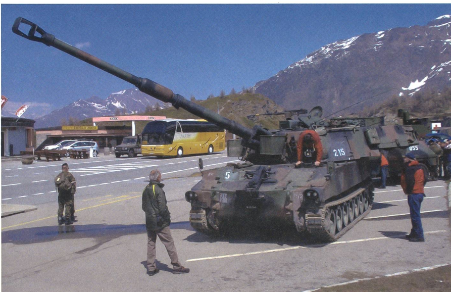
Die neueste kampfwertgesteigerte Version der Pz Hb M-109 auf dem Simplon. Das Rohr L47 weist jetzt eine Länge von 7,35 m (Rohrlänge des L39 Geschützes 6,20 m) auf.