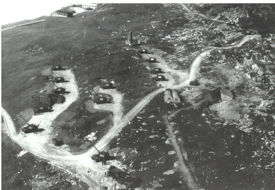
Foto Mirage IIIIRS der Aufkl Staffel 10

Die Munitionsmengen und -gewichte sowie der Treibstoffbedarf stiegen rasant. Allein eine Panzerhaubitze-Abteilung verfügte nun in der damaligen Dienstbatterie über 20 schwere Henschel-Lastwagen, 16 für die Munition, vier für den Treibstoff.