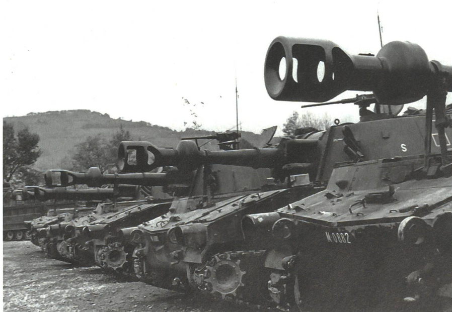
Erste Versuche der Hb Btr III/10 im WK 1967 mit M-109 in der Region Thun. Hier sind im Gürbegrüen vorne die zwei US-Versionen (M-109U) und hinten die drei deutschen Versionen (M-109G) mit der Rohrlänge L23 zu erkennen.

Der angestrebten Beweglichkeit in der Kampfführung fehlte allerdings ein ganz zentrales Element für die Direktunterstützung (DU), nämlich eine bewegliche und feuerstarke Artillerie. Mit den gezogenen 10.5 cm Haubitzen und Kanonen konnte dies nicht sichergestellt werden.