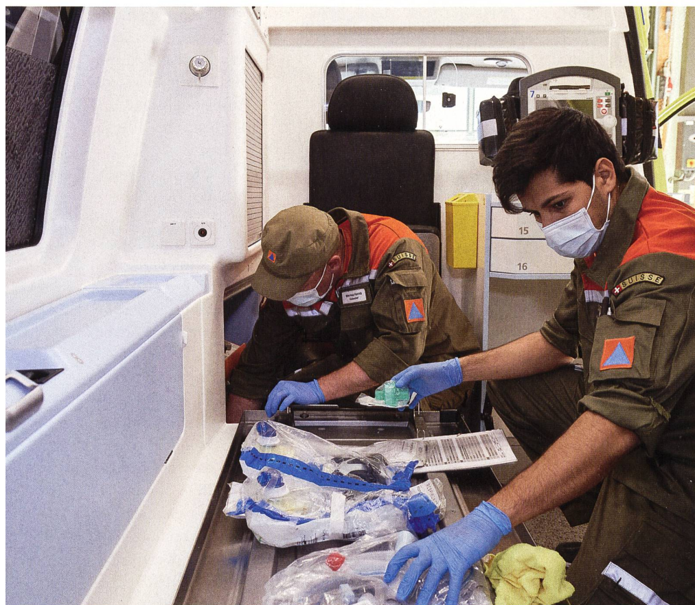
Am 10. Dezember 2021 wurde ein weiteres Aufgebot von Schutzdienstpflichtigen beschlossen. Dieses umfasst ein Kontingent von maximal 100 000 Diensttagen und gilt bis zum 31. März 2022.

Mit einem Bundesratsaufgebot kommt der Bund finanziell für den Zivilschutzeinsatz auf. Dies gibt den Kantonen Planungssicherheit und erleichtert die interkantonale Unterstützung. Der Bund