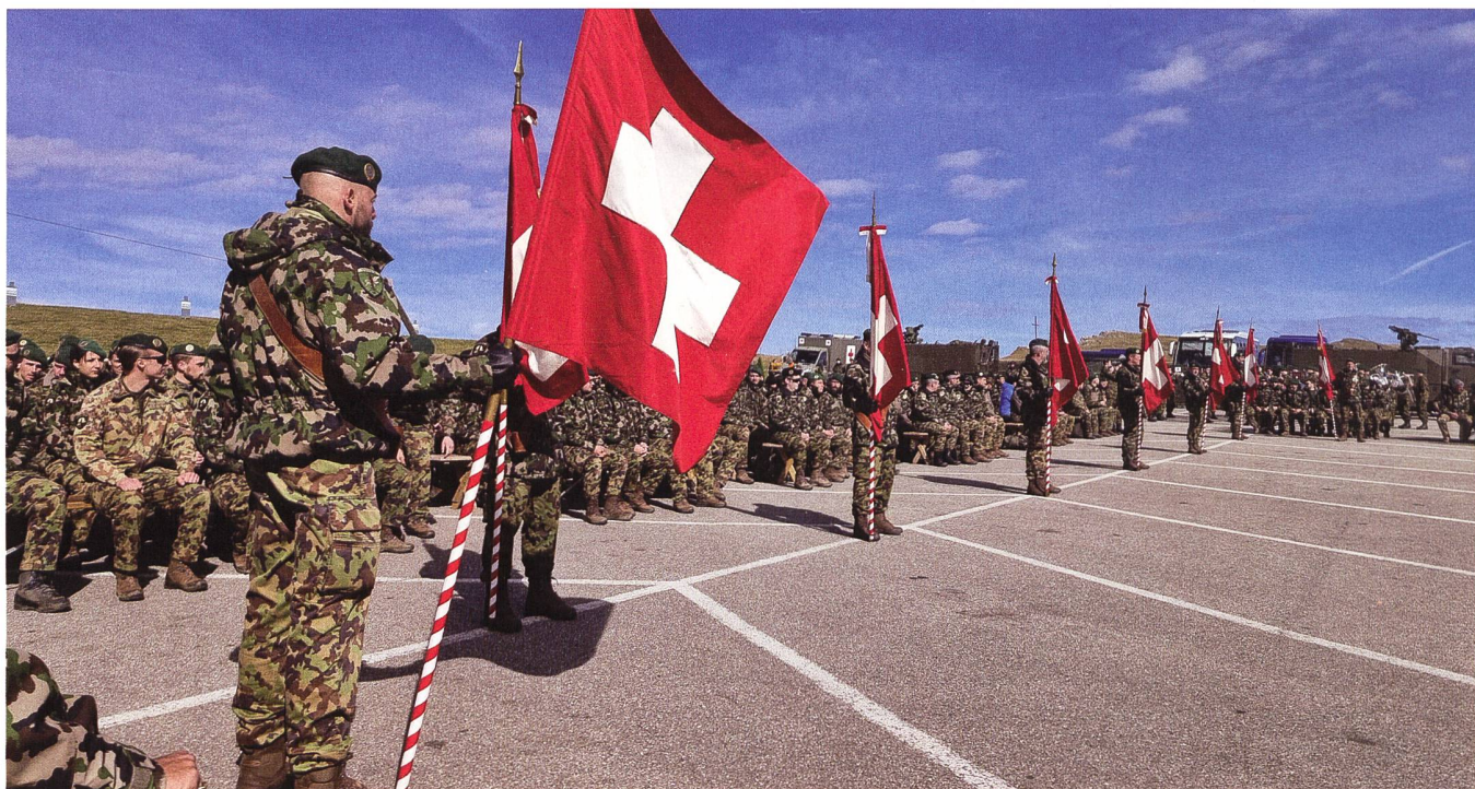
Rund 200 Teilnehmer besammelten sich zu früher Morgenstunde auf der Nordseite des Chasseral in Les Savagnières – Dessous.