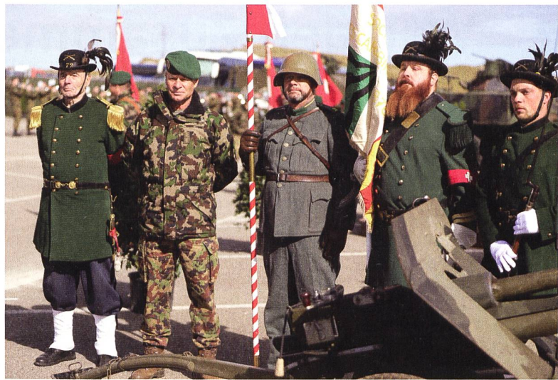
Kontinuität und Zukunft: Die Infanterie wird auch in Zukunft einen wichtigen Beitrag leisten.