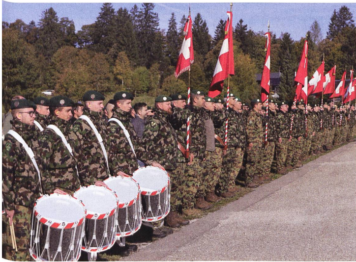
Fest steht: Die Infanterie wird auch in Zukunft einen wesentlichen Beitrag für Schutz- und Verteidigungsaufgaben leisten.

Sie wird im Mittelland vorwiegend in Agglomerationen und im schwierigen Gelände eingesetzt. Der Lehrverband Infanterie ist mit seinen neun Schulen und Kommandos in der ganzen Schweiz verteilt. Die rund 360 Mitarbeiter des Lehrverbandes bilden pro Jahr durchschnittlich 6000 Soldaten und 1000 Unteroffiziere und Offiziere aus.