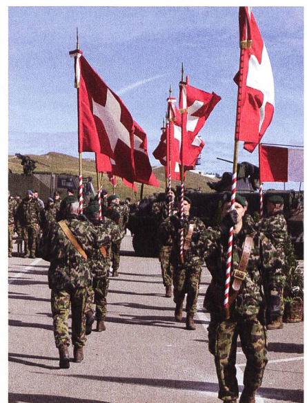
Die rund 360 Mitarbeiter des Lehrverbandes bilden pro Jahr durchschnittlich 6000 Soldaten und 1000 Unteroffiziere und Offiziere aus.

Dies hat unter anderem zur Folge, dass bei der Ausrüstung eine stärkere Ausrichtung auf mobile, modular einsetzbare und einheitlicher ausgerüstete Einsatzverbände vorgesehen sind.