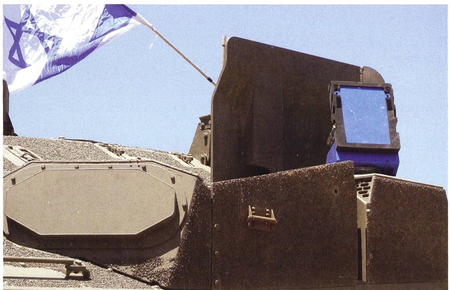
Das Trophy-System auf einem israelischen Kampfpanzer. Auf diesem Bild sichtbar: Eine blaue Patrone wurde als Übungsmunition in den Trophy-Werfer geladen.

Der Präsident der GDELS, Alfonso Ramonet, hält fest, dass moderne Schutztechniken eine zunehmend wichtige Rolle für die Überlebensfähigkeit der Besatzungen von Militärfahrzeugen bilden. +