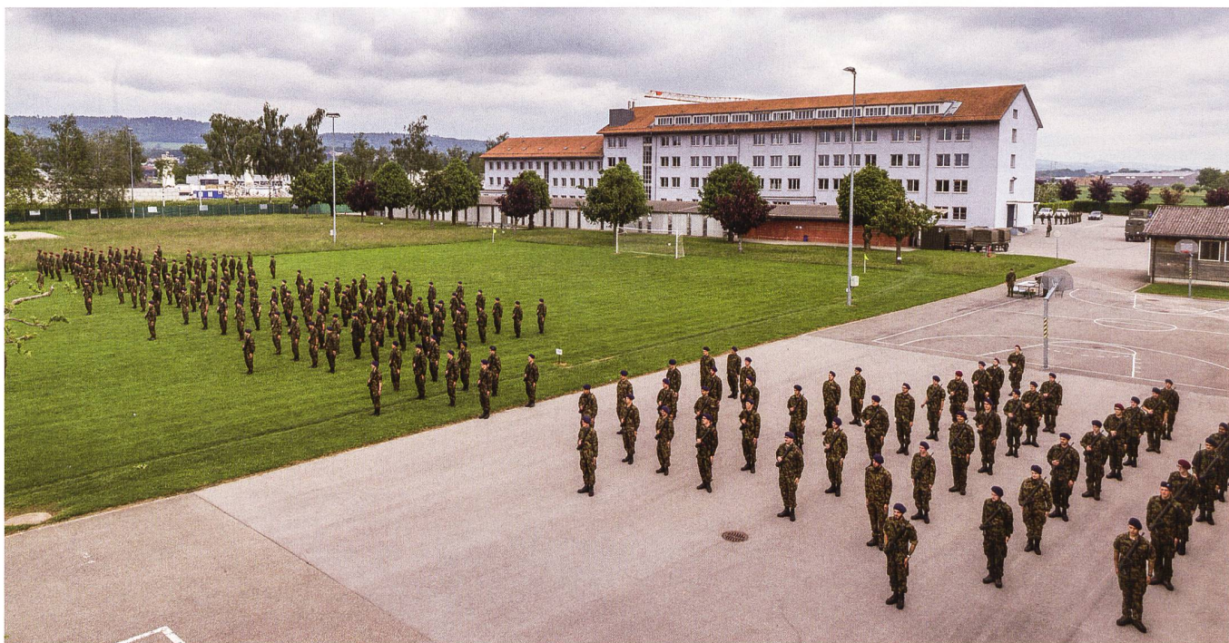
Silodenken anstatt Unité de doctrine? Kritiker bemängeln dies im neuen sicherheitspolitischen Bericht.