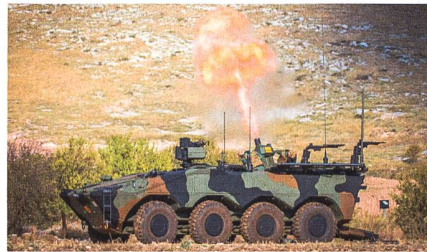
Minenwerferversion des VMB Freccia.

Das italienische Heer setzt die Ausstattung der Kampfbrigaden mit modernen Radpanzern fort. Die Direktion für Landstreitkräfte des italienischen Verteidigungsministeriums hat mit dem Konsortium Iveco - Oto Melara (CIO) einen Vertrag über die Lieferung von 40 gepanzerten 8x8-Radfahrzeugen Freccia, sechs