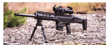
CZ Bren 2 PPS.