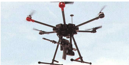
Feuersystem SMASH Dragon.

Das SMASH Dragon basiert auf dem bereits erprobten SMASH-Feuersystem, welches durch Zuhilfenahme einer hoch entwickelten Bildverarbeitung und einen ballistischen Rechner, somit auch ohne Emissionen, dem Schützen den Haltpunkt für einen Treffer mit sehr hoher Wahrscheinlichkeit in das Display der Optik projiziert und auch die Auslösung des Schusses steuert. Die aktuellste Version in Form des SMASH X4 wurde unter anderem erst im letzten Herbst von der Bundeswehr für die Drohnenabwehr erprobt. Das SMASH-Dragon-Modul ist laut Hersteller dazu vorgesehen in eine Vielzahl von Multicopter-Drohnen integriert werden zu können. Um die Missionsdauer bzw. die Bandbreite an kompatiblen Drohnen zu erhöhen, wurde bei der Entwicklung auf ein möglichst geringes Systemgewicht geachtet. Laut Smart Shooter wurde zudem eine effiziente Stabilisierung