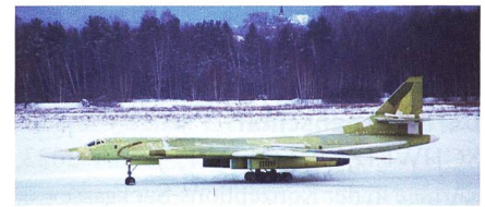
Jungfernflug der ersten neugebauten Tu-160.

Die russischen Streitkräfte setzen momentan dreizehn überschallschnelle Tupolew-Tu-160-Bomber ein; dabei handelt es sich weltweit um das grösste Kampfflugzeug. Der nuklearwaffenfähige Bomber kann bis zu Mach 1,9 schnell fliegen und hat eine Bombenzuladung von rund 35 Tonnen. Ohne Luftbetankung kann die Tu-160 bis zu 12 000 Kilometer weit flie-