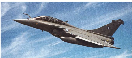
Erste Dassault Rafale in Griechenland.

Die ersten sechs von insgesamt achtzehn Rafale sind in Griechenland eingetroffen. Im vergangenen Sommer konnte Griechenland seine ersten sechs Rafale-Kampfflugzeuge in Empfang nehmen. Die Maschi-