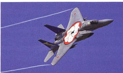
F-15J der JSDAF.

Zum Jahresende wurde das seit mehreren Jahren in Planung befindliche Programm zur Aufrüstung japanischer F-15J Eagle zum Japan Super Interceptors gestartet. Laut Pentagon-Mitteilung erhielt Boeing einen Auftrag in Höhe von 471,313 Millionen US-Dollar. Er umfasst die Konstruk-