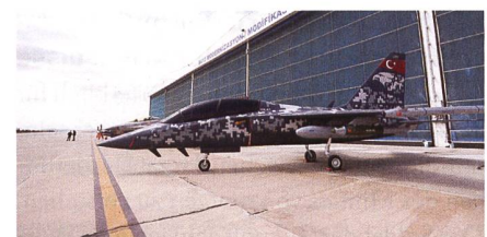
Leichtes Kampfflugzeug Hürjet.