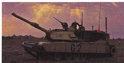
Ein M1A2 SEPv2 im Irak.

Das US-Verteidigungsministerium hat grünes Licht für einen möglichen Verkauf von Abrams M1A2 SEPv3 Kampfpanzern und zugehöriger Ausrüstung an Polen im