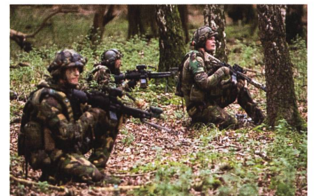
Niederländische Soldaten nehmen an den Zebra Sword Übungen in Amersfoort, Niederlande, teil.

Die Niederlande werden das Smash AD-System erwerben, das auf früheren Bestellungen bei Smart Shooter aufbaut. Die derzeitige Reichweite des Systems beträgt etwa 250 Meter, was der effektiven Reichweite von Sturmgewehren in der Hand entspricht. Experten gehen davon aus, dass das