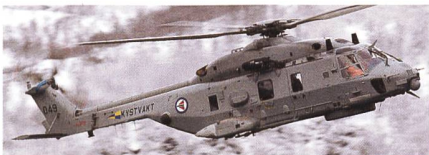
Transporthelikopter NH90 der norwegischen Luftwaffe.

Norwegen ist mit dem Transporthelikopter NH90 nicht zufrieden und will alle dreizehn von vierzehn bestellten Helikoptern an den Hersteller zurückgeben. Norwegen ist mit dem mittelschweren Transporthelikopter NH90 nicht zufrieden und sieht sich gezwungen aus dem Vertrag auszusteigen und den Helikopter an Airbus Helicopters zurückzugeben. Diese harte Massnahme haben der Verteidigungsminister Bjørn Arild Gram und die Chefs des Beschaffungsamtes und der Streitkräfte mitgeteilt. Der Helikopter wurde vor zwanzig Jahren bestellt und erfülle die An-