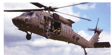
Grossbestellung von H-60M Black Hawk-Helikoptern.