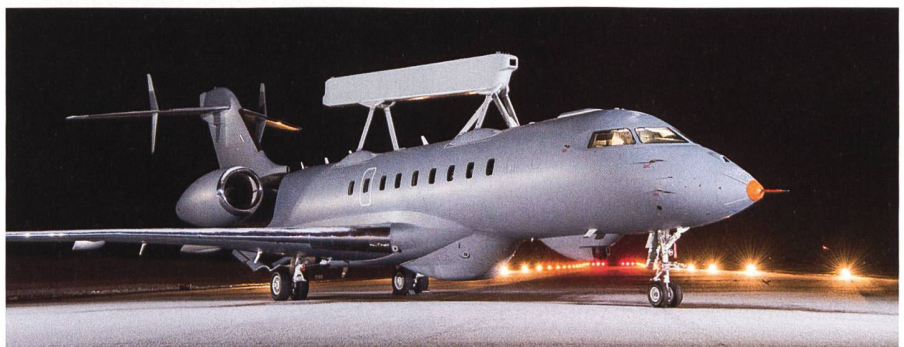
Saab GlobalEye für die schwedische Luftwaffe.