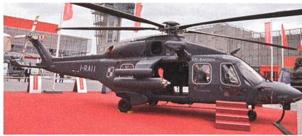
Mehrzweckhelikopter AW149 von Leonardo.

Das polnische Verteidigungsministerium hat wie erwartet den Auftrag für 32 Mehrzweckhelikopter AW149 an PZL-Świdnik erteilt. Das Unternehmen befindet sich vollständig im Besitz von Leonardo. Der Vertrag beläuft sich auf 1,76 Mrd. Euro. Die Lieferungen von einer lokalen Endmontagelinie sollen im Zeitraum 2023-2029 erfolgen. Der Auftrag enthält auch Logistik-, Schulungs- und Simulatorpakete. Das Logistikpaket umfasst einen Bestand an Ersatz- und Verbrauchsteilen sowie Ausrüstung für die Bodenabfertigung der Helikopter. Das Schulungs- und Simulatorpaket umfasst eine umfassende Ausbildung von Piloten und technischem Personal sowie die Lieferung einer Reihe fortschrittlicher Simulatoren und Schulungsausrüstung. Die neuen Helikopter werden unter anderem